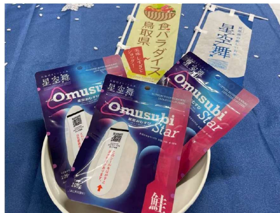
【星空舞「星空おむすび」】