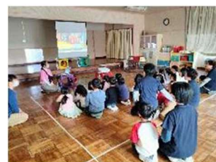
R4年のカニ集会の様子