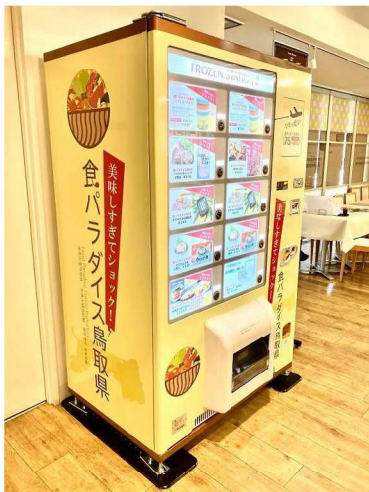
【食パラダイス鳥取県自動販売機】