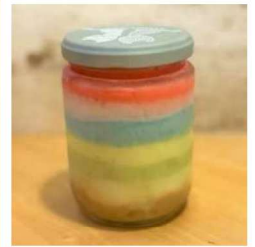
【レインボーアイス】