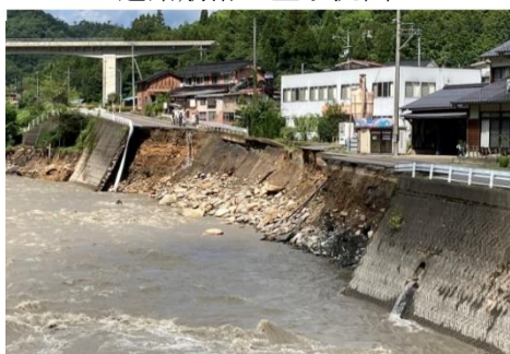
国道482号（鳥取市用瀬町別府） 道路崩落・土砂流出