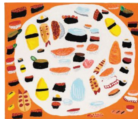
山本美和(お寿司のバラエティパック)2020年 様々な種類のお寿司が白いお皿に収まりきれないほどにたくさん描かれた作品。お寿司へのほとぼしる情熱を朗らかな色彩と確かな描写力で表現している