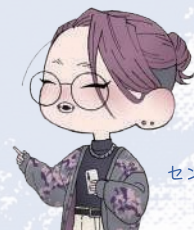
センターマスコット まみちゃん

障がい者の芸術・文化活動に関する必要な情報を収集し、インターネット等を活用して、広く発信するよ。