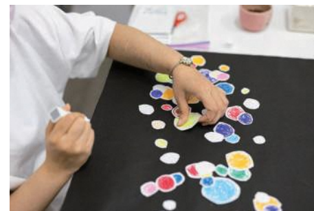
様々な表現手法を積極的に取り入れてきた吉岡さつきさん (上)ロックやクラシックなどの音楽を聴きながらこんこんと湧きだす創作アイデアを即興的に表現した作品。同シリーズのキャラクターを縫いぐるみにした立体作品もある (下)様々な色を黒い画面上に散らばせてそのリズムミカルな動きを楽しみながら制作