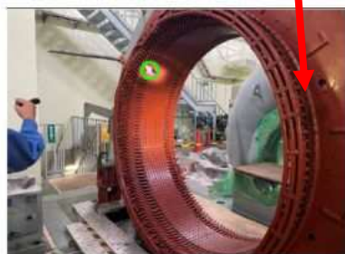
右：1号 水車発電機 出力：6,700kW