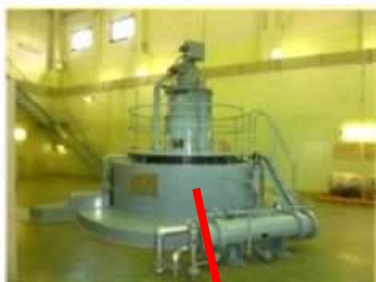
左：2号 水車発電機 出力：2,500kW