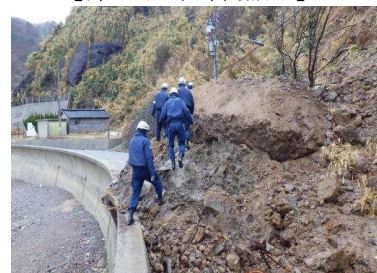
無人集落の警戒活動状況