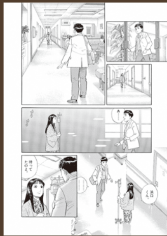
「冬の動物園」©パピエ