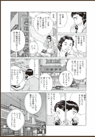
「冬の動物園」©パピエ

『冬の動物園』は、自伝的モチーフを巧みに取り込みながら、そんな時代を描いた作品です。2005年から2007年にかけて制作されました。同じく60年代末期を描いた自伝的掌編『松華樓』は1998年の作品、これに次いで長編『遙かな町へ』が描かれます。