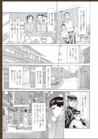
「冬の動物園」©パピエ