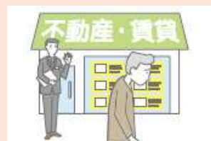
障がいがあることを理由に入店を拒否

正当な理由なく、障がいを理由として、財・サービスなどの提供を拒否したり、制限したり、条件を付けたりするような行為