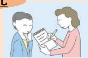
きこえにくい方と筆談ボードで会話

障がいのある方から、社会の中にあるバリア（社会的障壁）を取り除くために何らかの対応を必要としているとの意思が示されたときに、負担が重すぎない範囲で対応すること