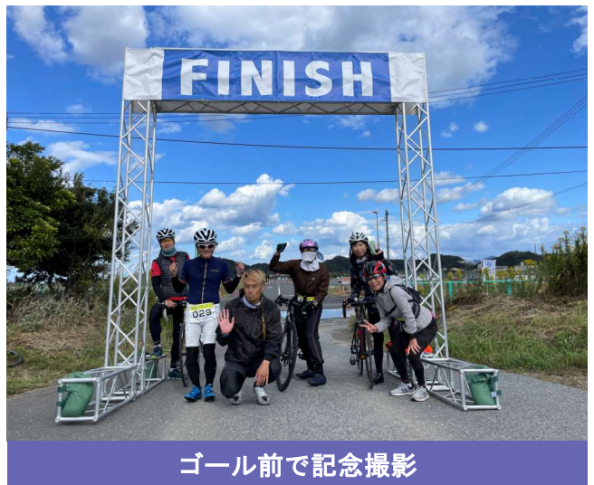
ゴール前で記念撮影

当日は雨が降る中ドキドキのスタートとなりましたが、午後には雨も上がり青空の下、笑顔でゴールする参加者の姿が印象的でした。