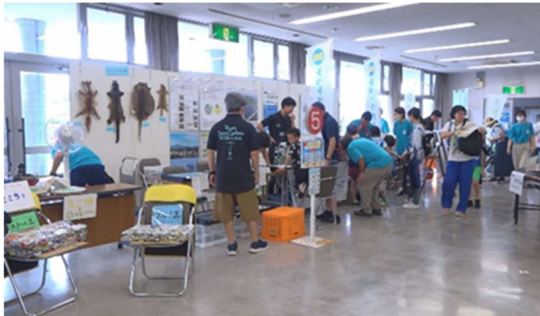
第20回中海環境フェアinよなご

令和5年8月26日（土）、中海体験クルージング&中海環境フェアinよなごが家族連れなど多くの方に参加いただき、4年ぶりに通常開催することが出来ました。