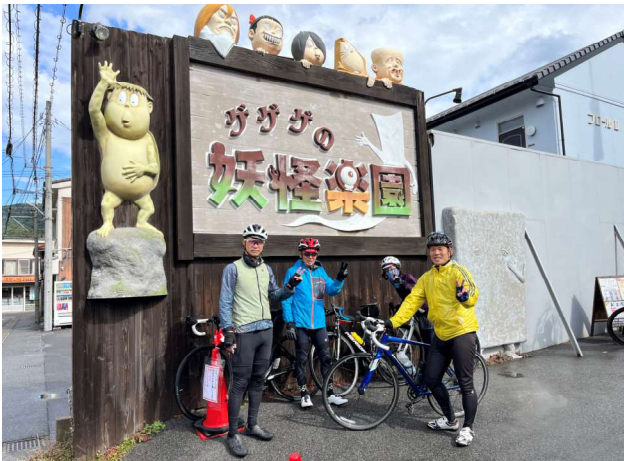
ゲゲゲの妖怪樂園前でパシャリ

今回、中国4県から160名の参加があり、家族連れからチームまで多くの方に参加していただきました。