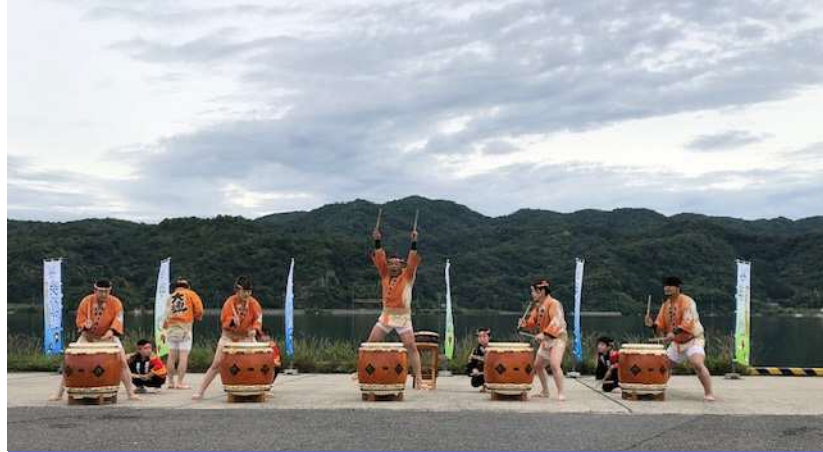
境港大漁太鼓荒神会による太鼓の演奏

令和5年6月11日（日）、中海・宍道湖周辺の5市（境港、米子、安来、松江、出雲）において、地域の皆様にご参加いただき、沿岸の一斉清掃を実施しました。