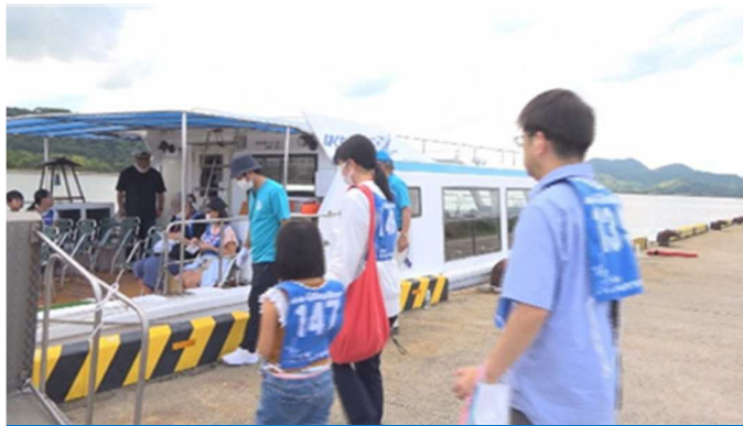
はくちょう号によるクルージング

環境フェアは米子食品会館で14ブースを開設しました。官民が同じステージで中海の生き物、環境を守る取り組み、中海の水質改善について展示し、参加者は参加・体験する事で出展者との交流を行いました。