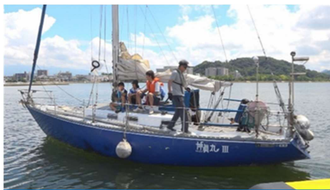
ヨットによるクルージング