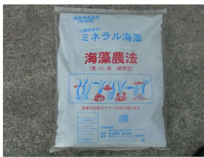
海藻を利用した肥料