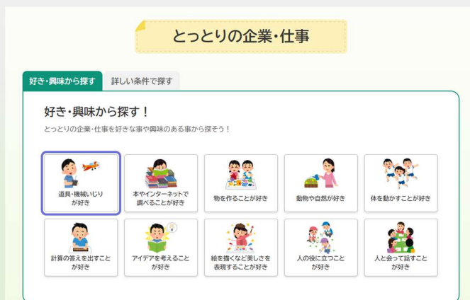
（とっとり教育ポータルサイト内 とっとりの企業・仕事 トップ画面）