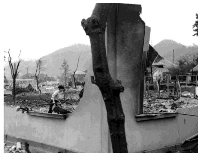
焼失した君野邸（昭和27年4月19日撮影）

門構えだけが残された屋敷内から、県立鳥取図書館を望む。この付近に火の手が回ったのは、大火当日の午後8時頃であった。