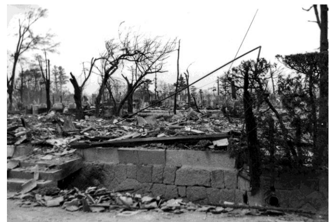
焼失した建物（昭和27年4月19日撮影）

右端が県立鳥取図書館。一部は焼失したが、被害を免れた講堂は、被災者の避難所として開放された。