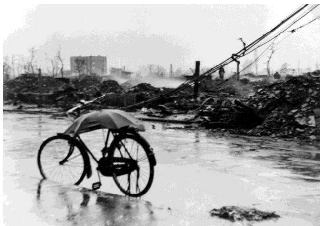
豪雨（昭和27年4月20日撮影）

餘熱のある焼跡からは湯気が立昇る。嘗ての繁華街若桜街道筋百村付近を見る。左後方は国警本部跡のビル（写真台紙に書かれた解説文より）