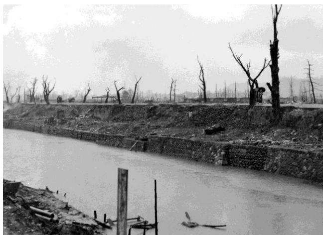
袋川沿いの桜並木（昭和27年4月20日撮影）

餘熱のある焼跡からは湯気が立昇る。嘗ての繁華街若桜街道筋百村付近を見る。左後方は国警本部跡のビル（写真台紙に書かれた解説文より）