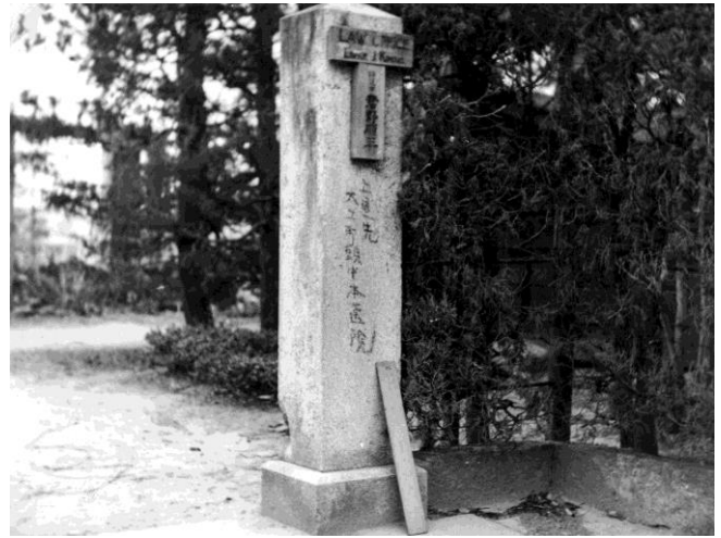
君野邸の門柱（昭和27年4月19日撮影）

一方で、猛火に耐えた建造物もあった。 えびす 戎町の富士銀行（現在の旧島根銀行ビル）、二階町の ごぞうえん 五臓圓、西町の県立鳥取図書館で、いずれも鉄筋コンクリート造であった。また、駅前通りの一部は、市民のバケツリレーにより、延焼を防ぐことができた。