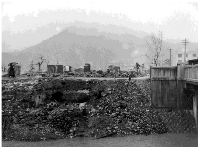
若桜橋から久松山を望む（昭和27年4月20日撮影）

この大火により、160本の桜樹が被災した。現在の桜並木は大火後に植えられたものである。