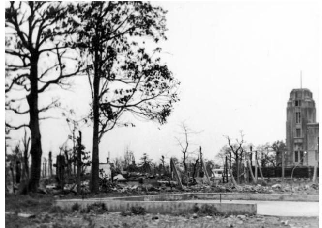
西町の県立鳥取図書館（昭和27年4月19日撮影）

右端が県立鳥取図書館。一部は焼失したが、被害を免れた講堂は、被災者の避難所として開放された。