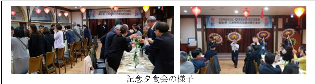
記念夕食会の様子