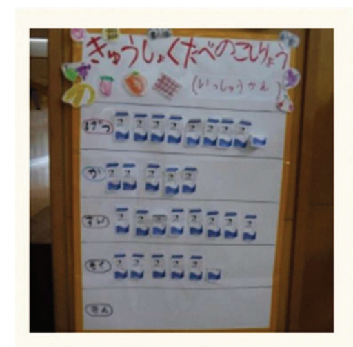
<残飯量の見える化>園のエントラン スに掲示してあります。目指せ、残飯 ゼロ!