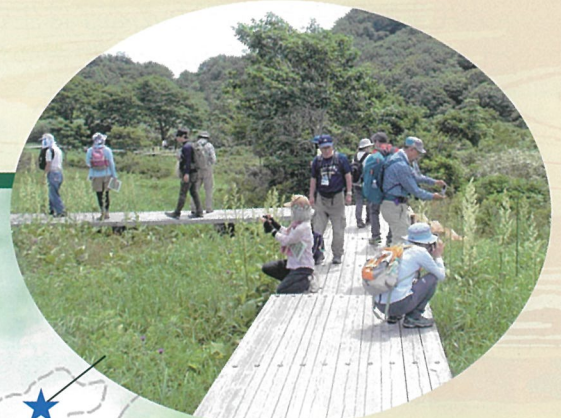
木道からバイケイソウを観察