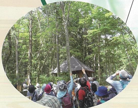
自然学習歩道で野鳥の姿を探す