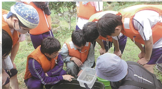
▲オオサンショウウオの卵を初めて見たよ