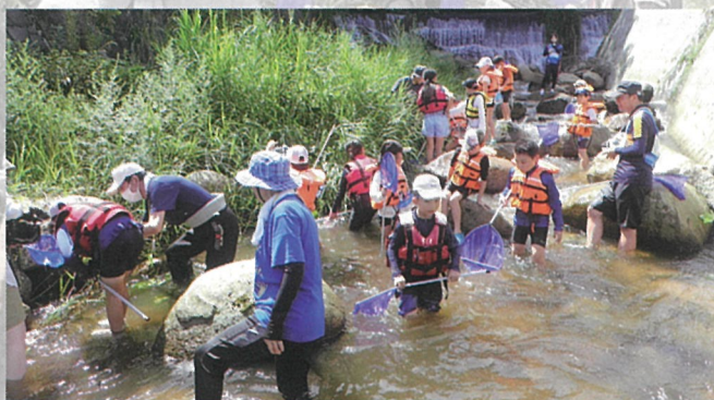
▲午前部 何がとれるかな？

体験学習会を終えた子どもたちは、「たくさんの生き物がいる環境を守るために、川にごみを捨てないように気を付けたい。」と、話してくれました。