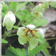
サンインシロカネソウ