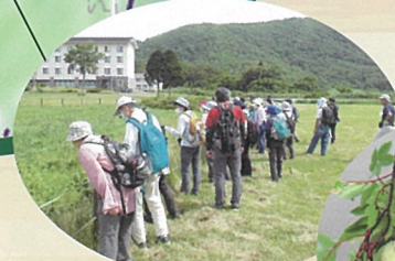
池の周りでモリアオガエルの卵塊を発見