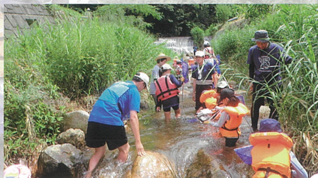
▲午後部 難関を越えてさらに上流へ