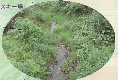
湿原からしみだした水が、流れとなる