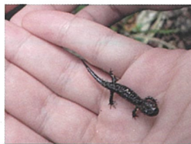
チュウゴクブチサンショウウオ

今回、募集定員を大幅に上回る方に応募いただき、誠にありがとうございました。ご希望に添えなかった皆様には申し訳ございませんでした。この日野川源流探訪は本会の核となるイベントです。来年以降も継続して実施してまいりますので、今後の御参加をお待ちしています。