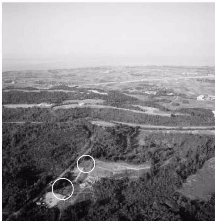
写真1 南東上空からみた松尾頭地区（円内が今年度調査地）

本書では、第18次発掘調査の報告および第19次発掘調査の概要報告を行う。第19次発掘調査の正式な報告は、平成19年度刊行の報告書において、第16次発掘調査（平成17年度）の報告と併せて行う予定である。