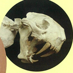
ディンクティス 実物化石