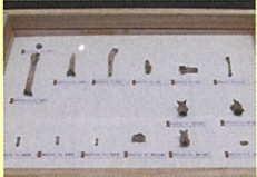
長崎県カラカミ遺跡から出土した日本最古のイエネコの骨 (香城市教育委員会蔵)