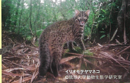
イリオモテヤマネコ