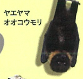
ヤエヤマ オオコウモリ

日本に生息するイリオモテヤマネコとツシマヤマネコは何を食べてどのように生きているのか、その生態をフィールド研究にもとづいて詳しく紹介します。