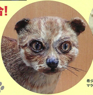
希少! マライヤマネコ