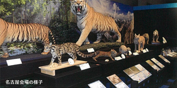
名古屋会場の様子