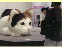
巨大イエネコ模型 (名古屋会場の様子)