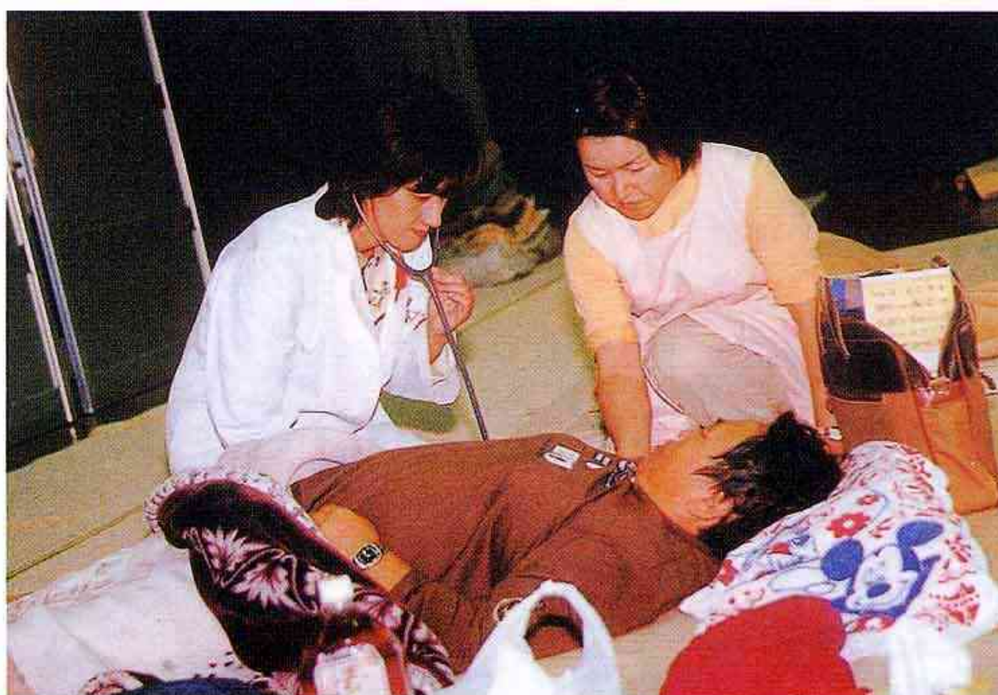
避難所での医療班の活動