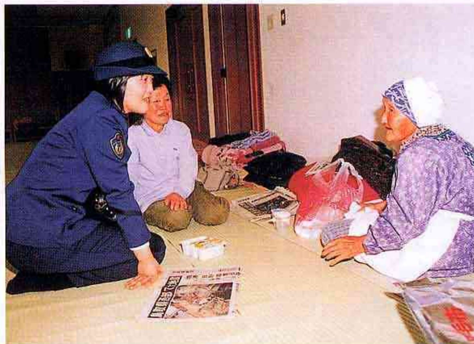
警察コスモス隊 避難所を訪問し、相談を受け付ける隊員