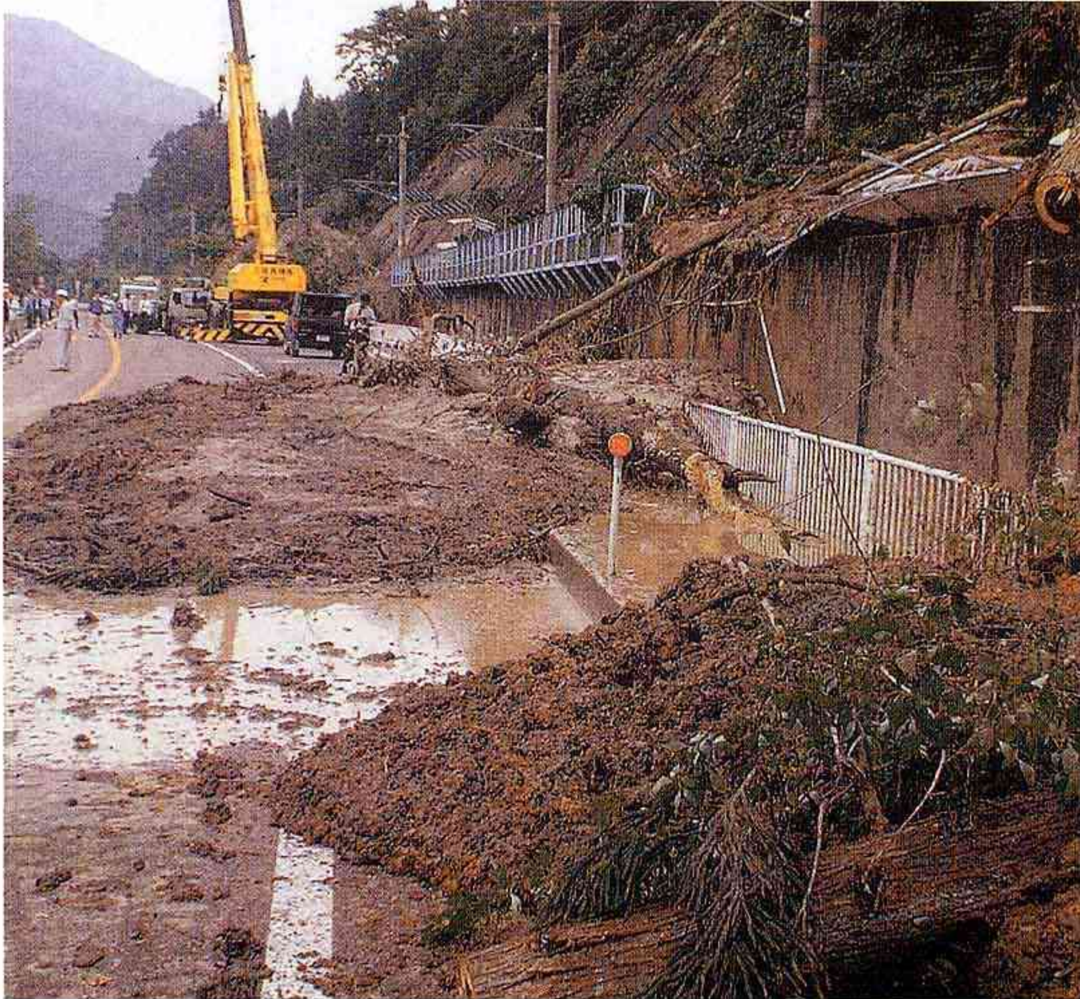
崩落した土石によってふさがれたJR伯備線と道路（日野町） （山陰中央新報 平成12年10月9日）