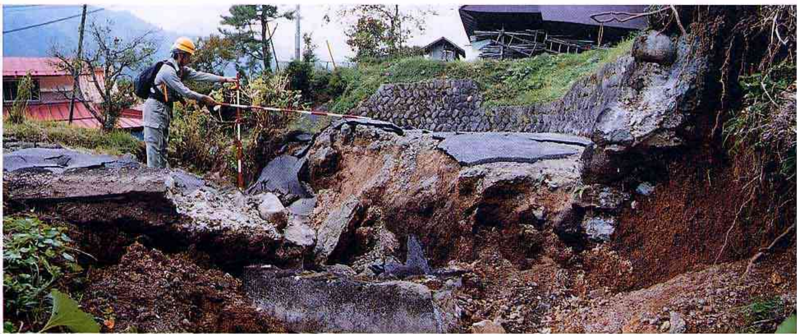
日野町下黒坂地区 地滑りによる崩落