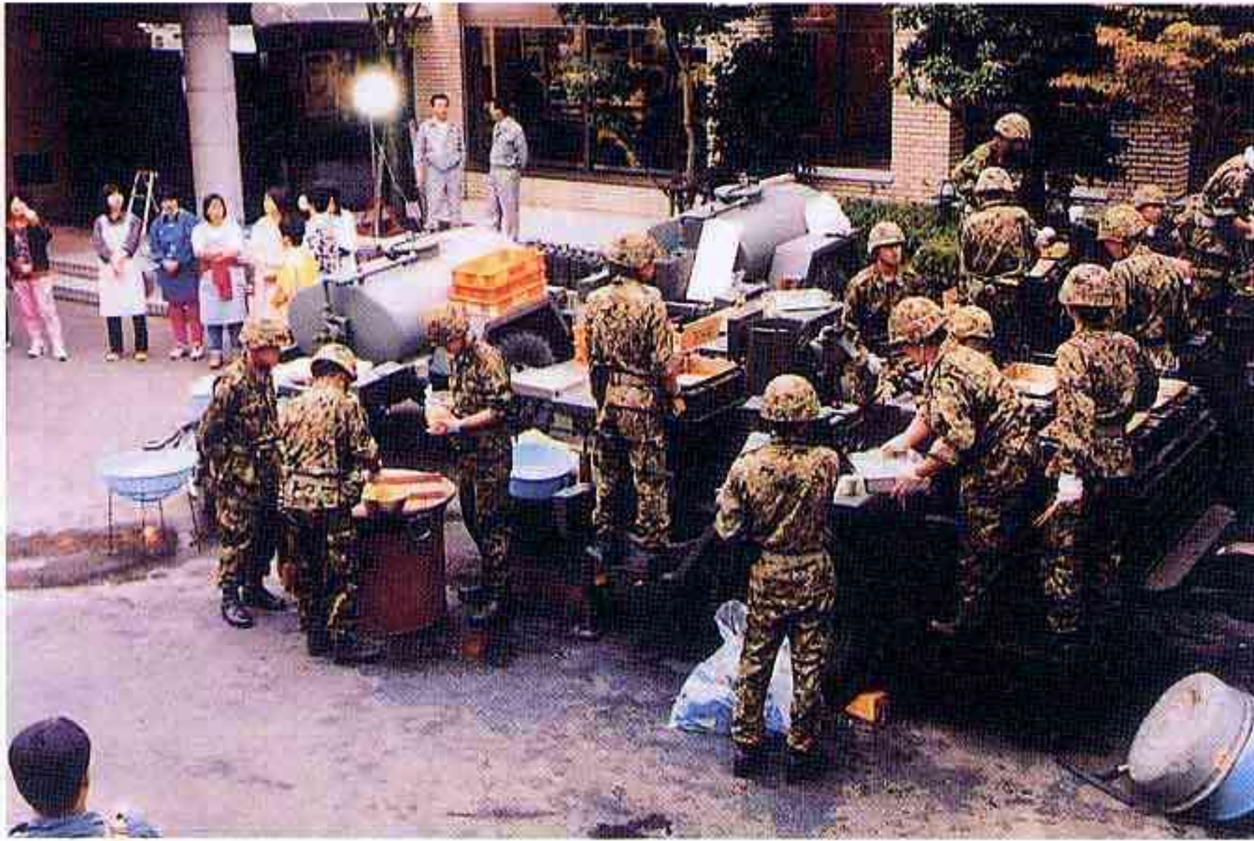
炊き出しをする自衛隊 (日野町)