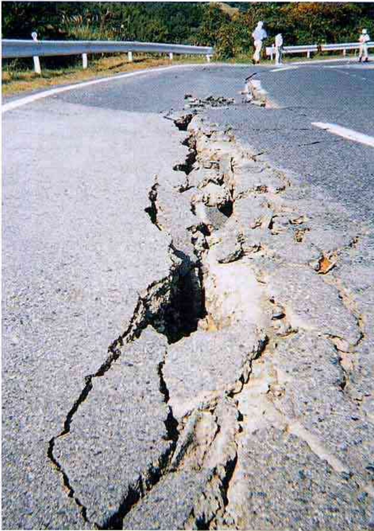
一般県道日野溝口線における道路亀裂（溝口町）