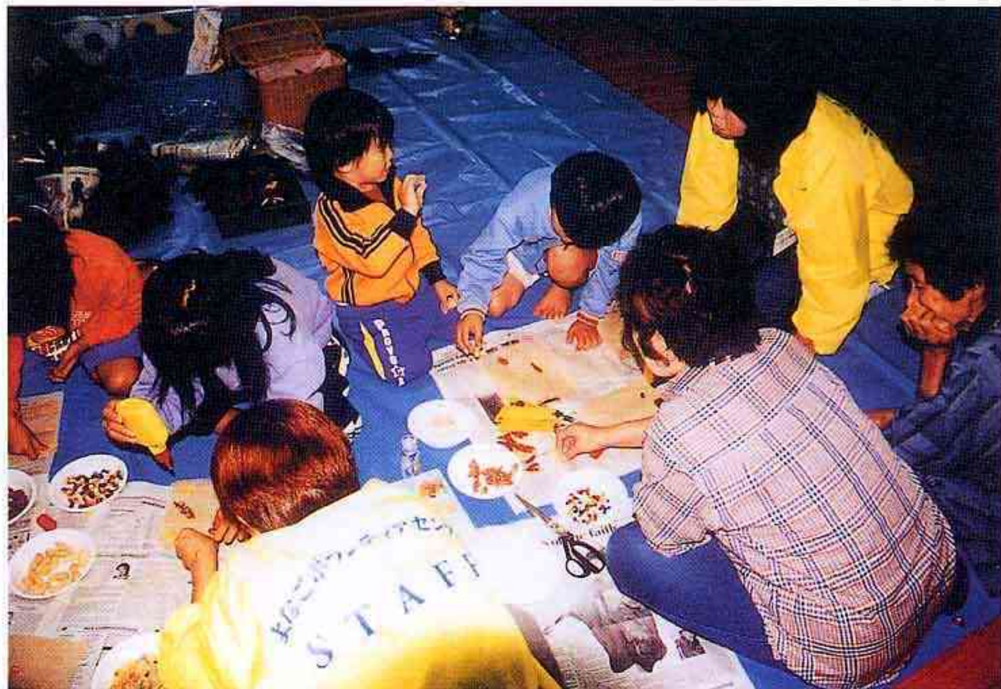
避難所で託児サービスをするボランティアセンターのスタッフ(日野町)