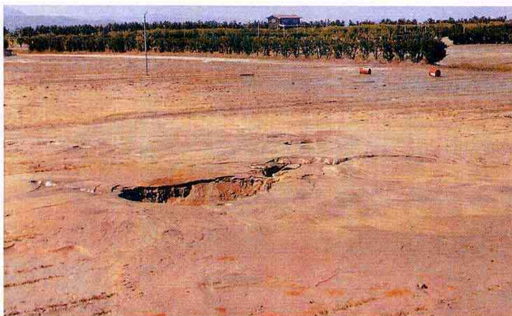
液状化により陥没した ニンジン畑