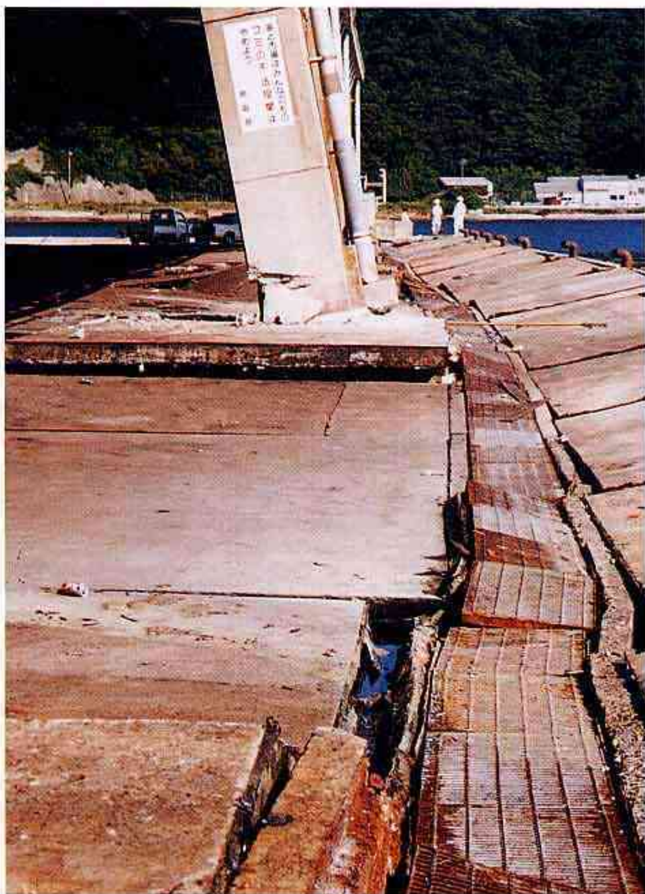
東へ移動した市場支柱