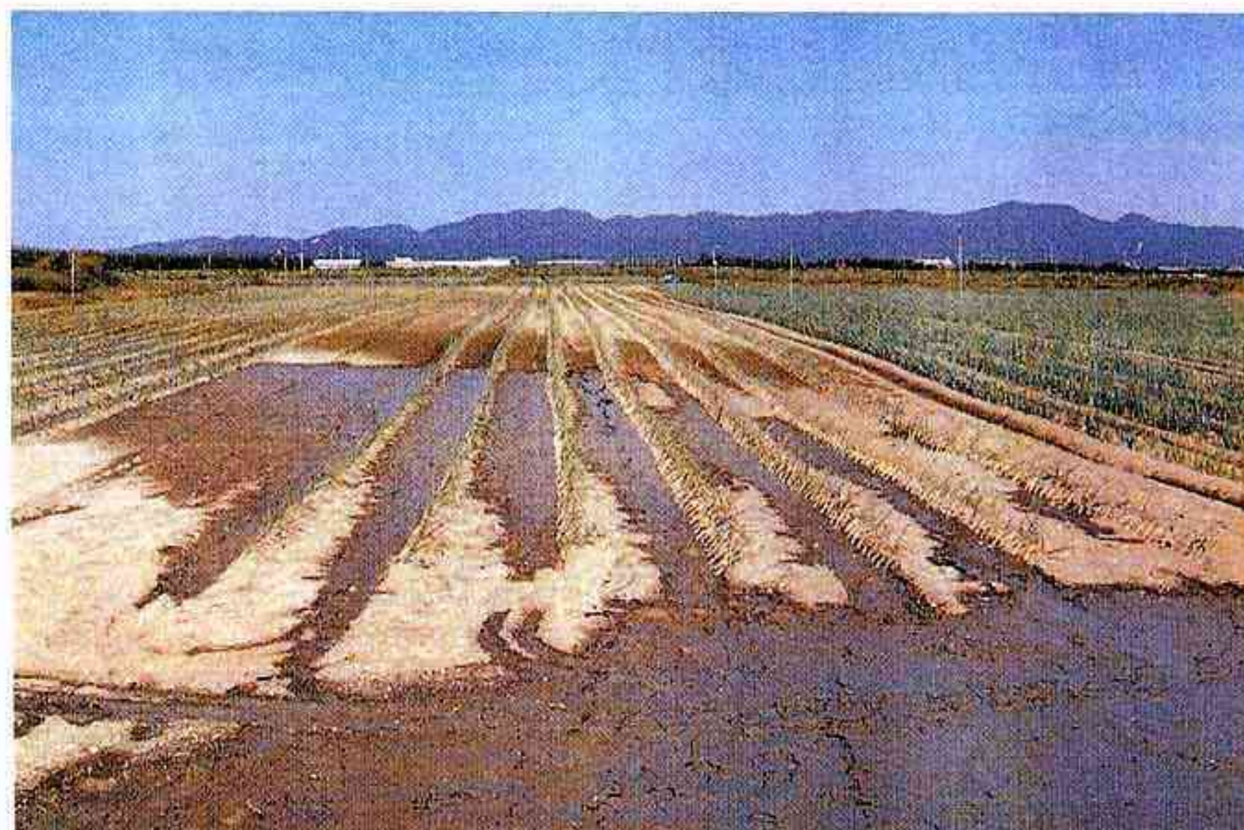
液状化による被害を受けた 白ネギ畑