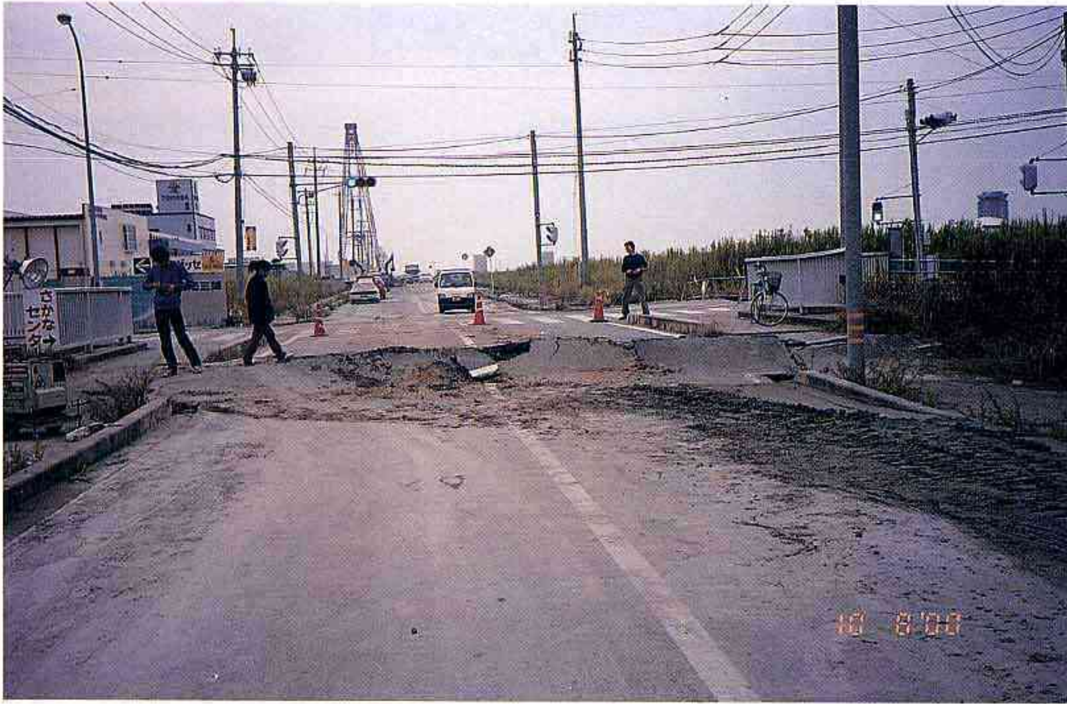
竹内工業団地内 液状化で噴出した土砂と道路の損傷（境港市）