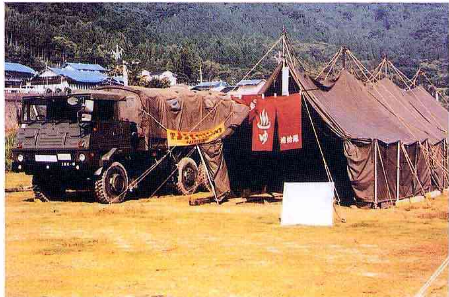
簡易風呂による 入浴サービス(日野町)