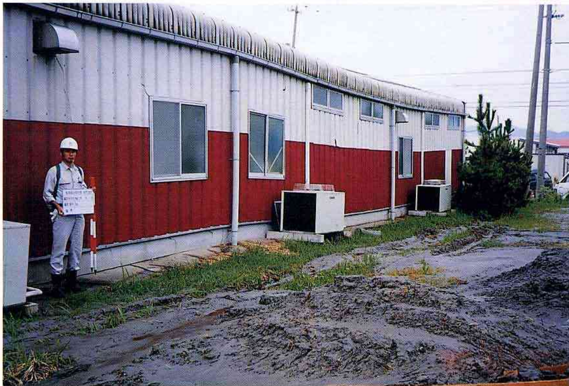
液状化による沈下で変形した建物