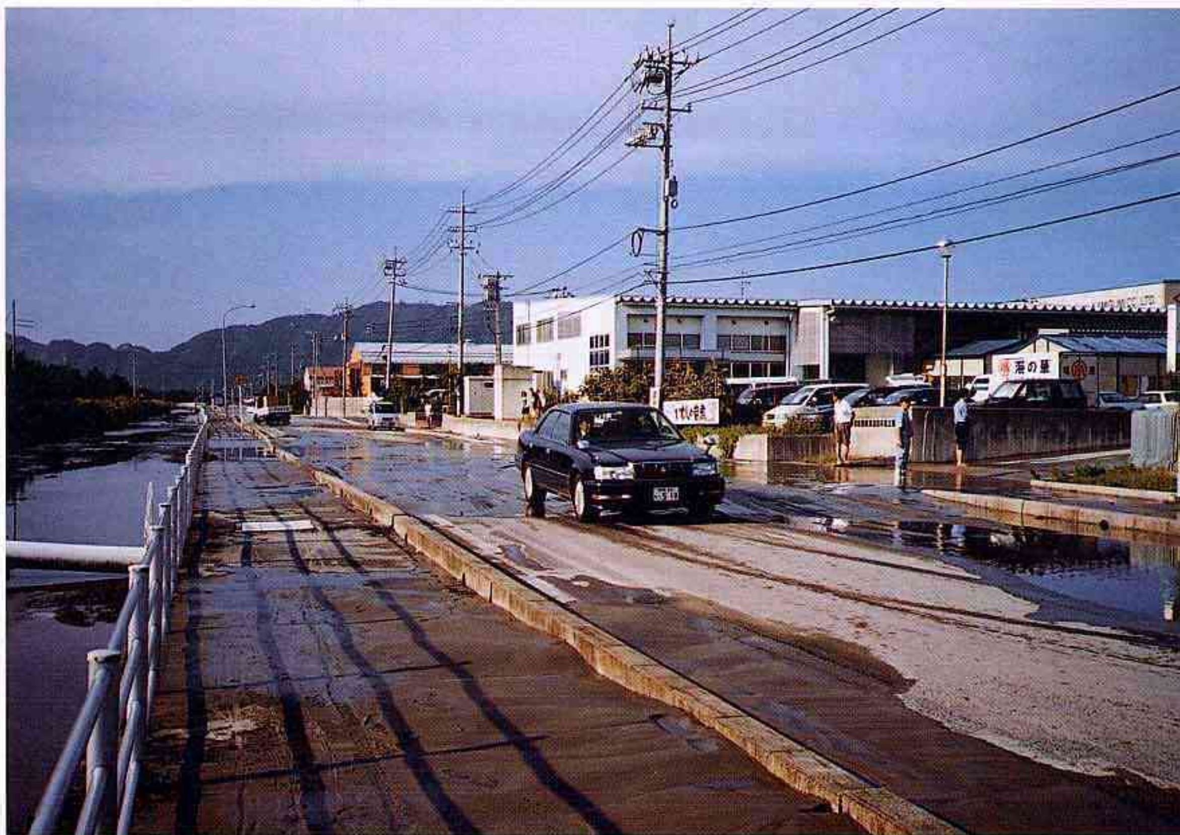
境港臨海道路の液状化