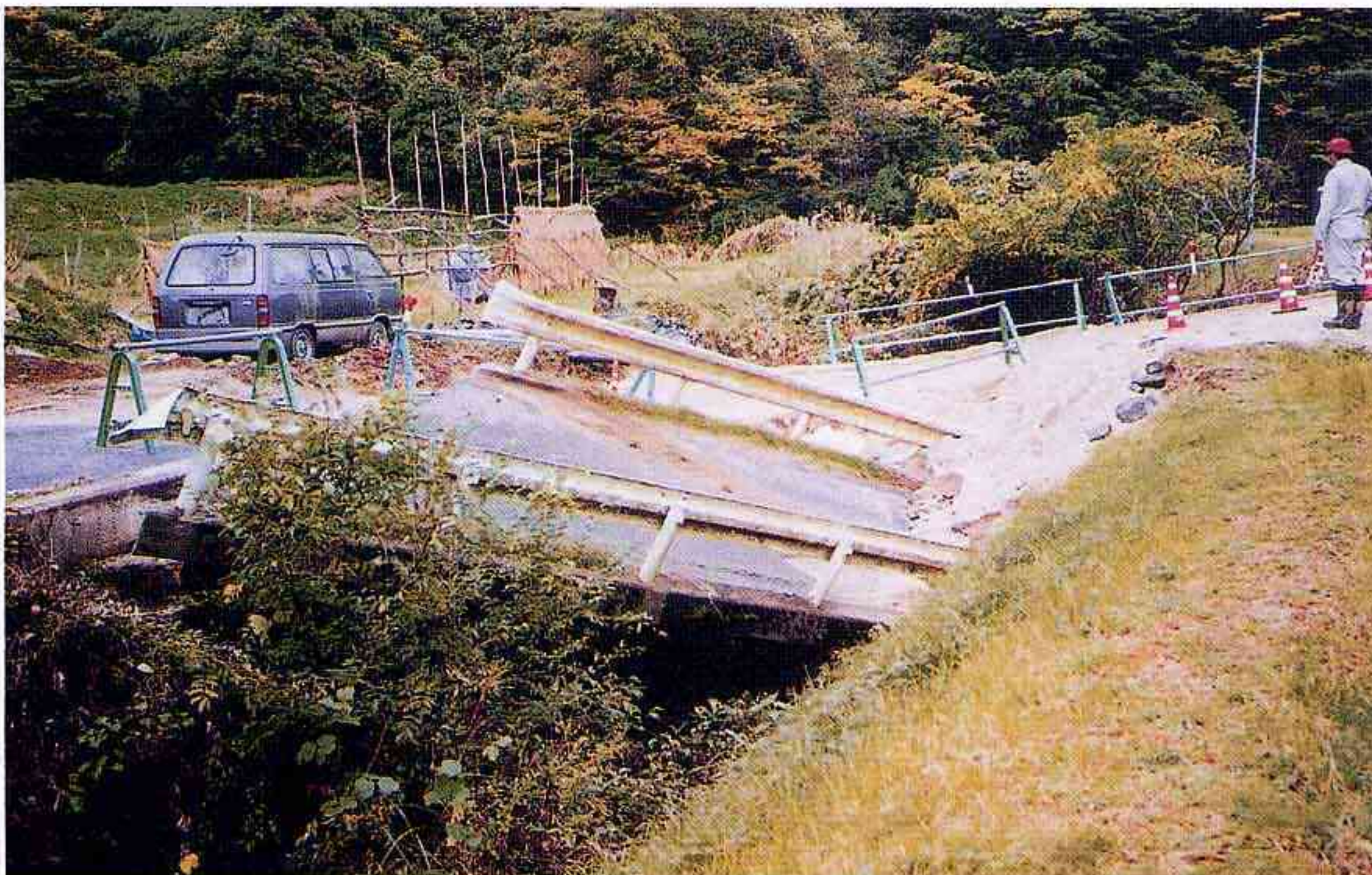
地盤がずれ、外れてしまった橋（西伯町）