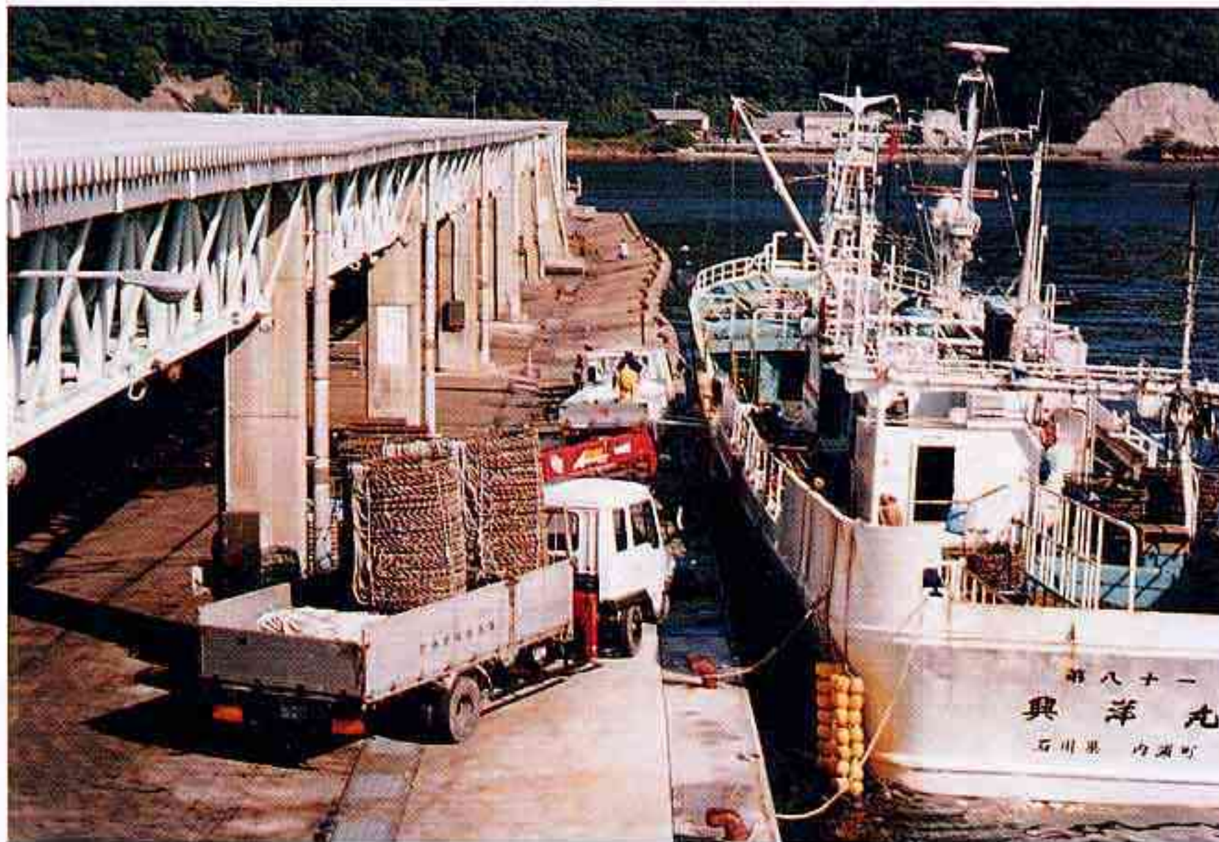
境漁港 約120mにわたり湾曲したかにかご岸壁