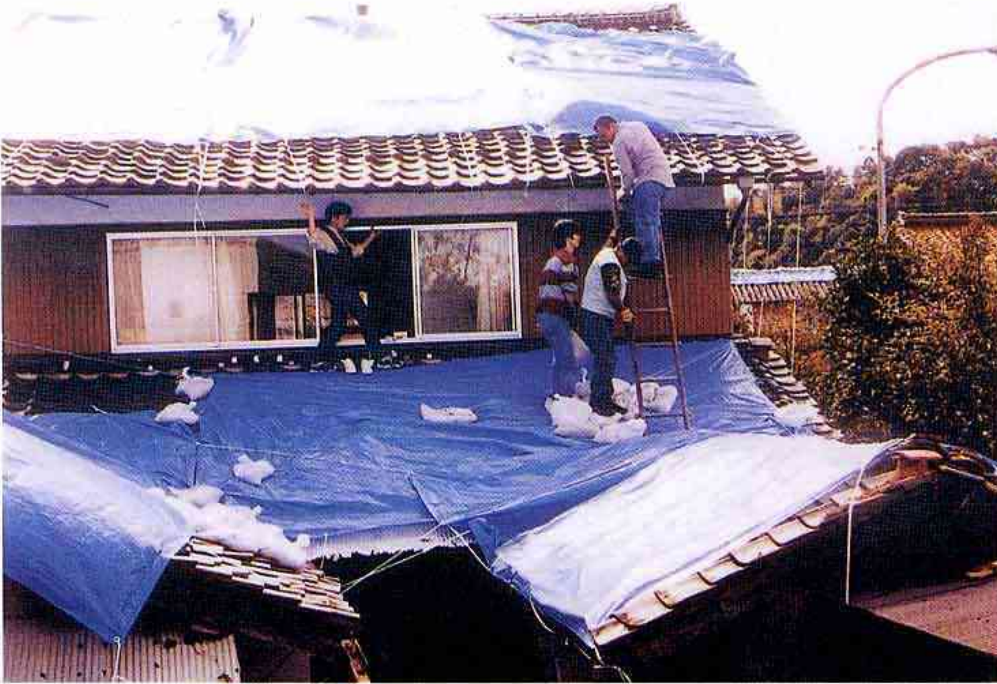
シート張りをするボランティア（西伯町）