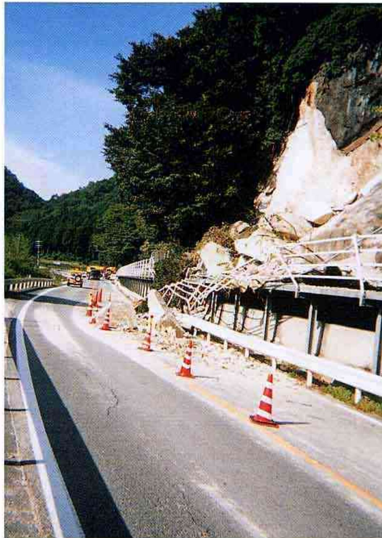
一般国道180号における法面崩落（日野町）