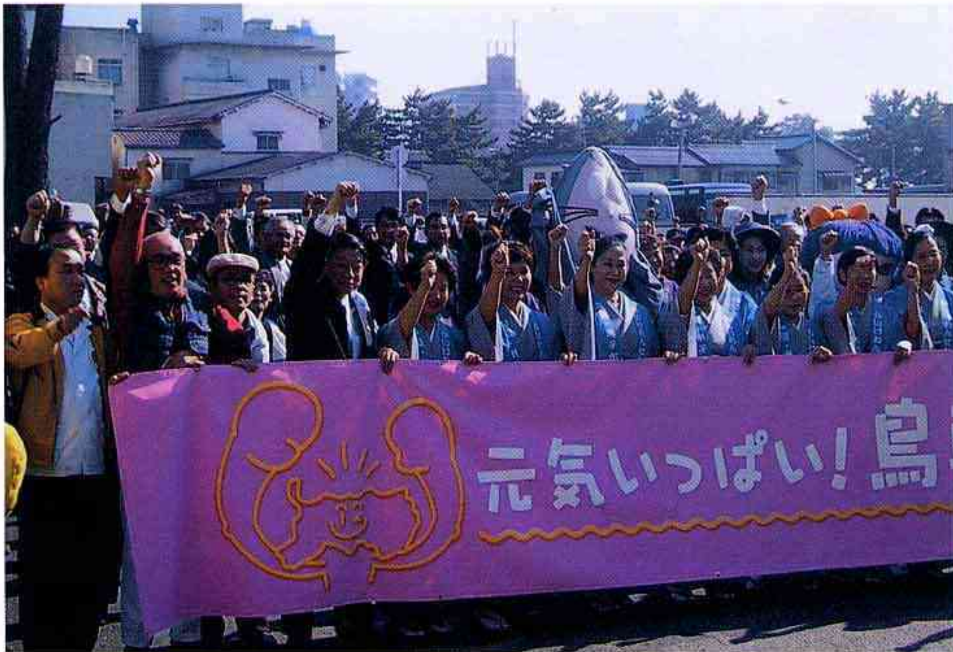
皆生温泉で行われた「元気いっぱい！鳥取県」宣言（米子市）