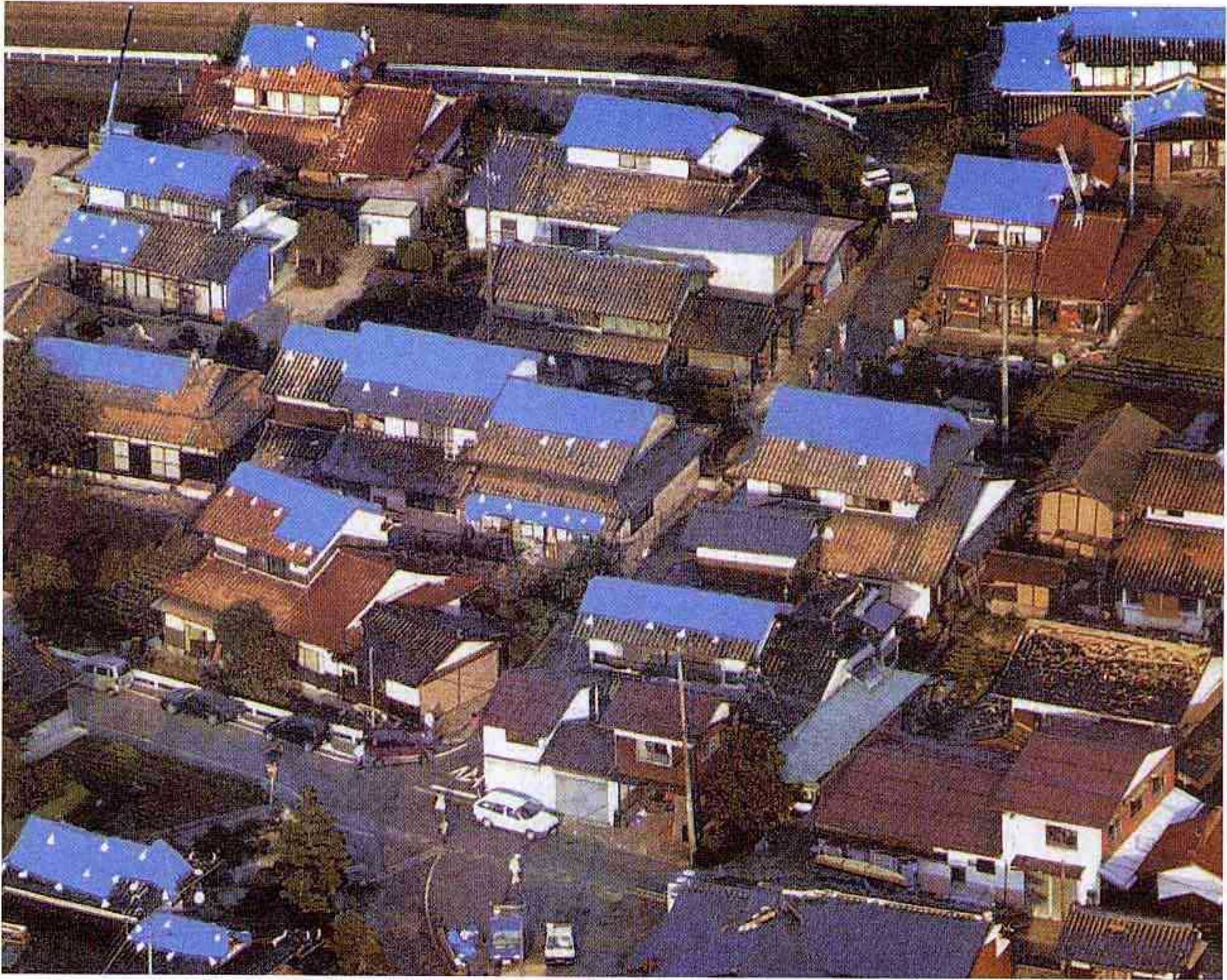
瓦がはがれたり、屋根が壊れたため、雨を防ぐためのシートがかけられた住宅（日野町） （日本海新聞）