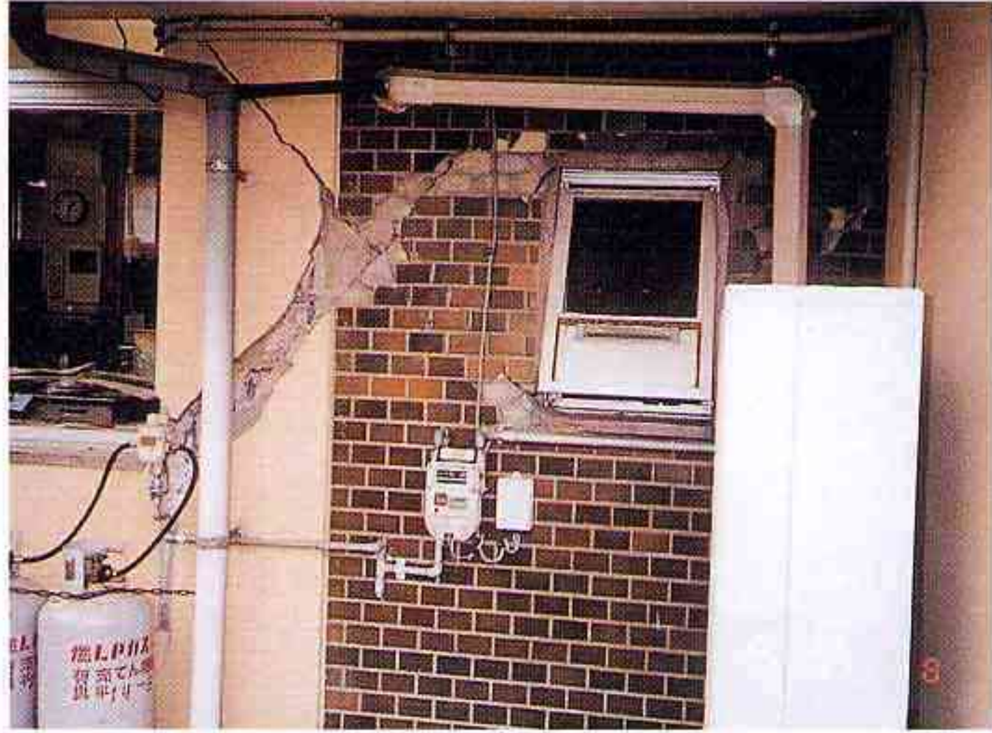
校舎の柱などに多数の亀裂が入り半壊状態となった会見小学校