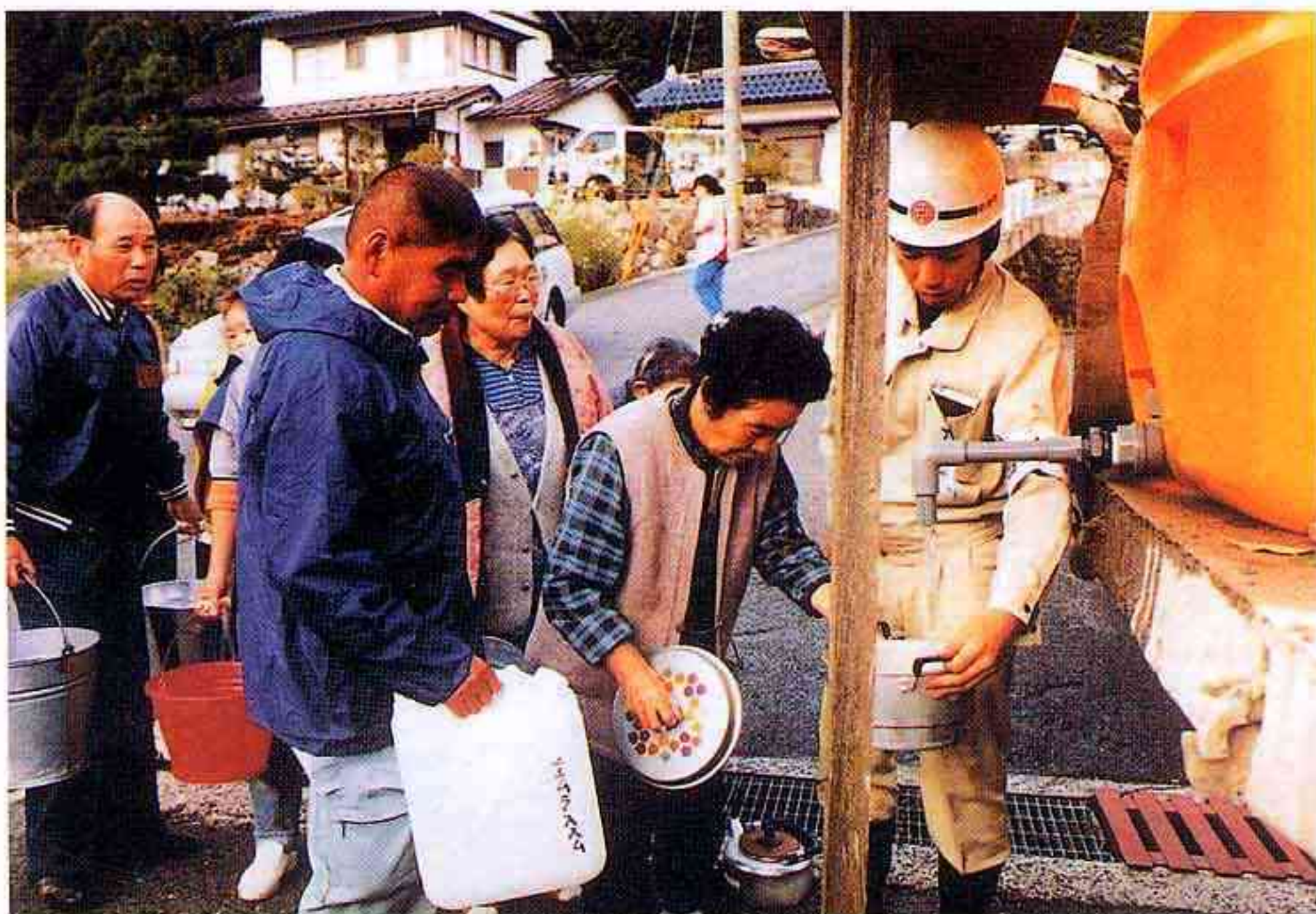
給水車による給水活動（日野町）