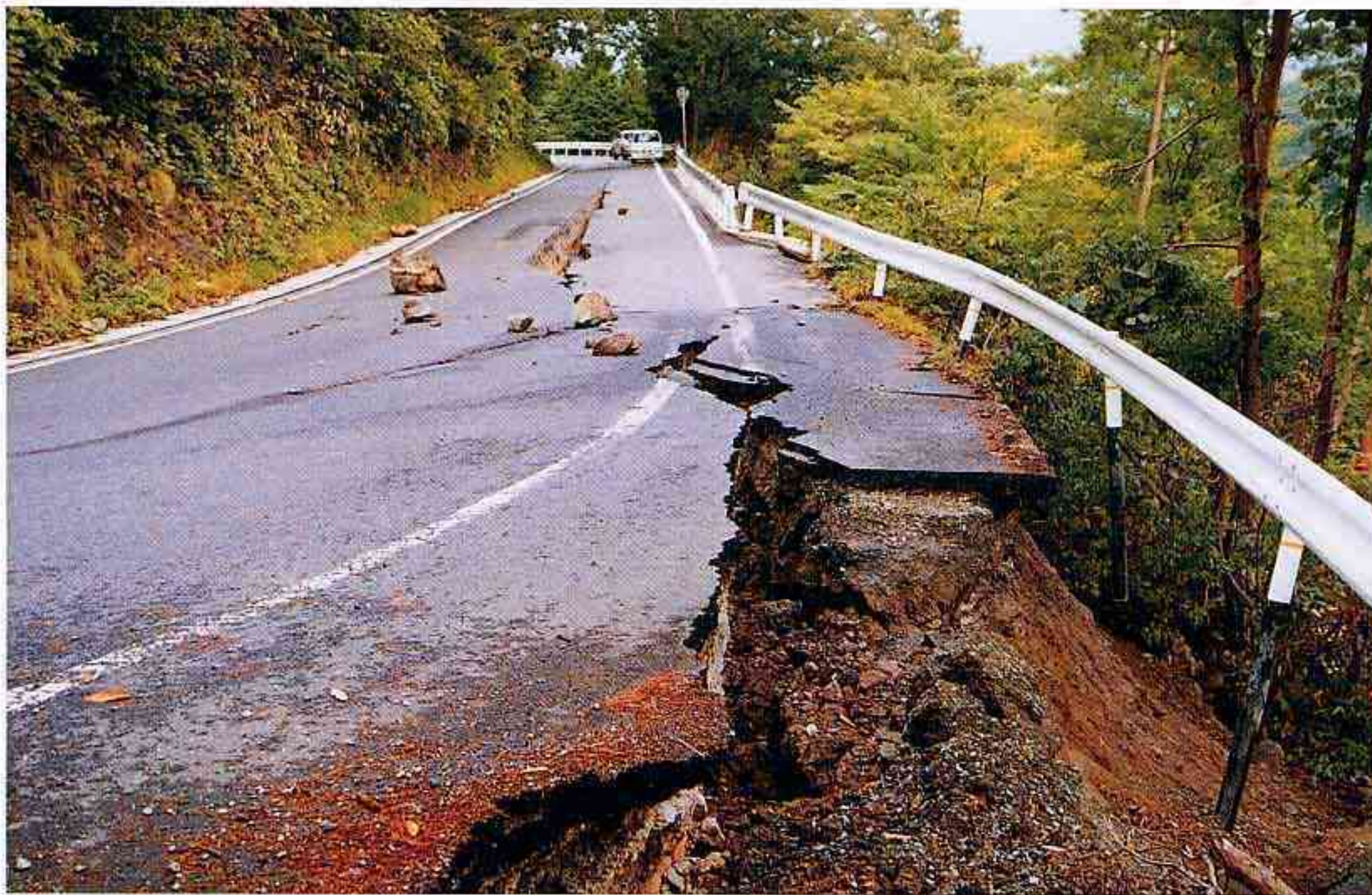
主要地方道岸本江府線における路肩崩壊と道路亀裂（江府町）