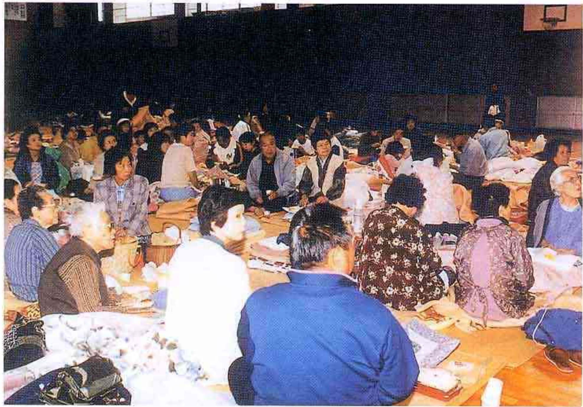
日野町内の中学校に避難した人々