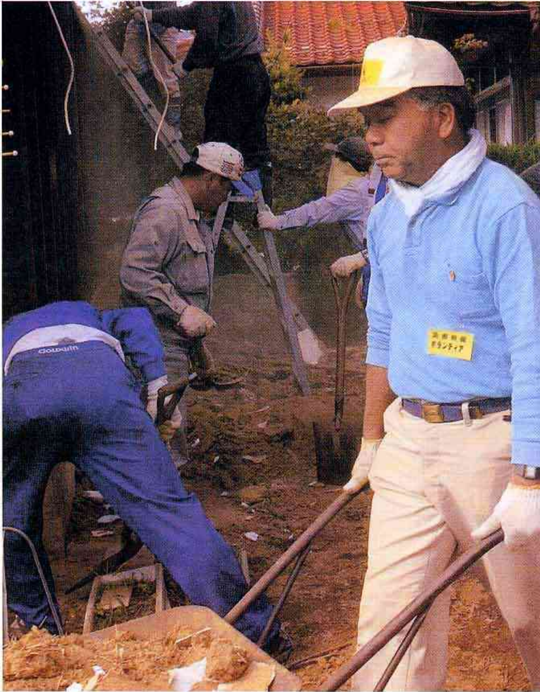
崩壊した住宅の壁や瓦を運び出すボランティア(日野町)