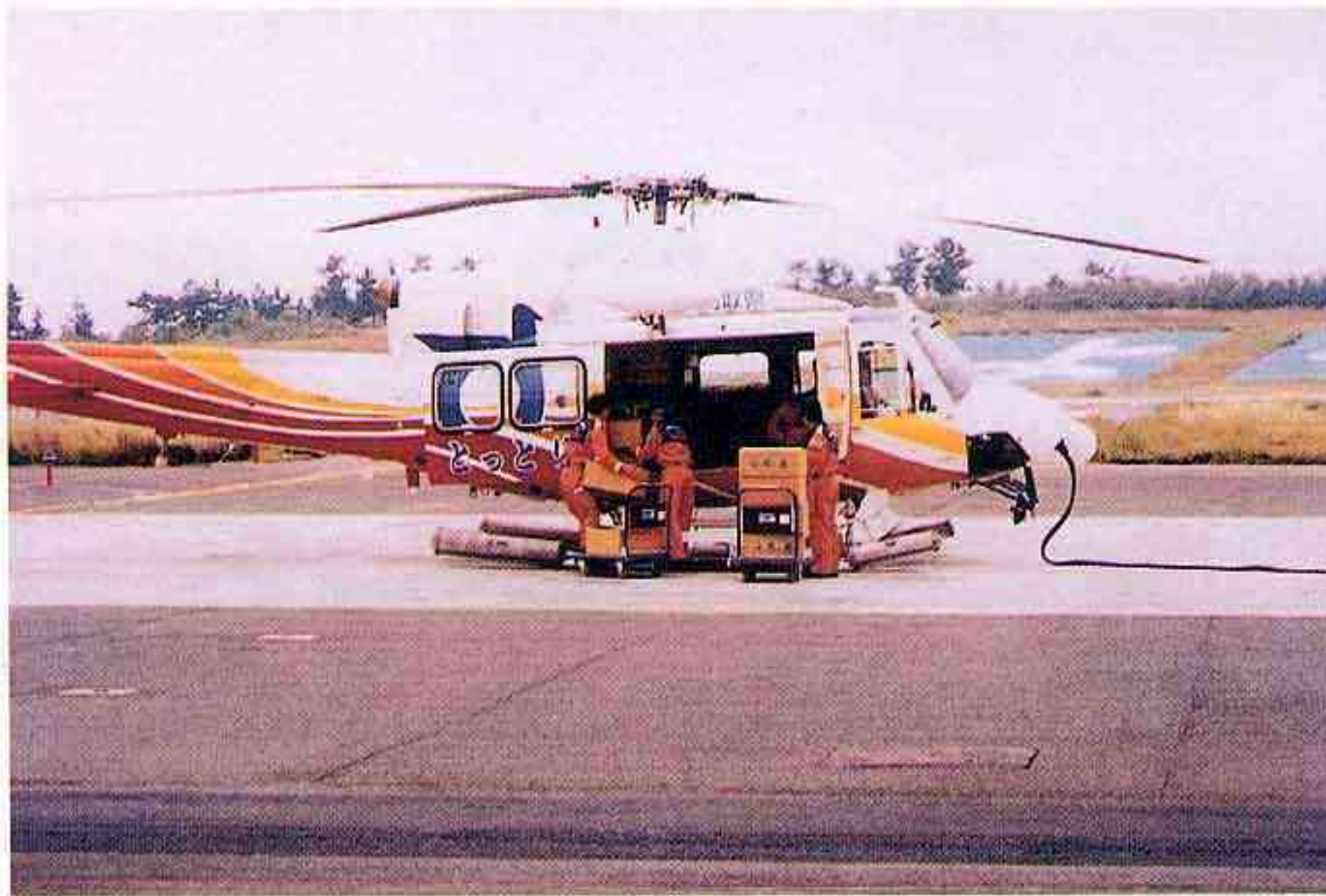
消防防災航空隊による鳥取市から被災地への弁当の搬送