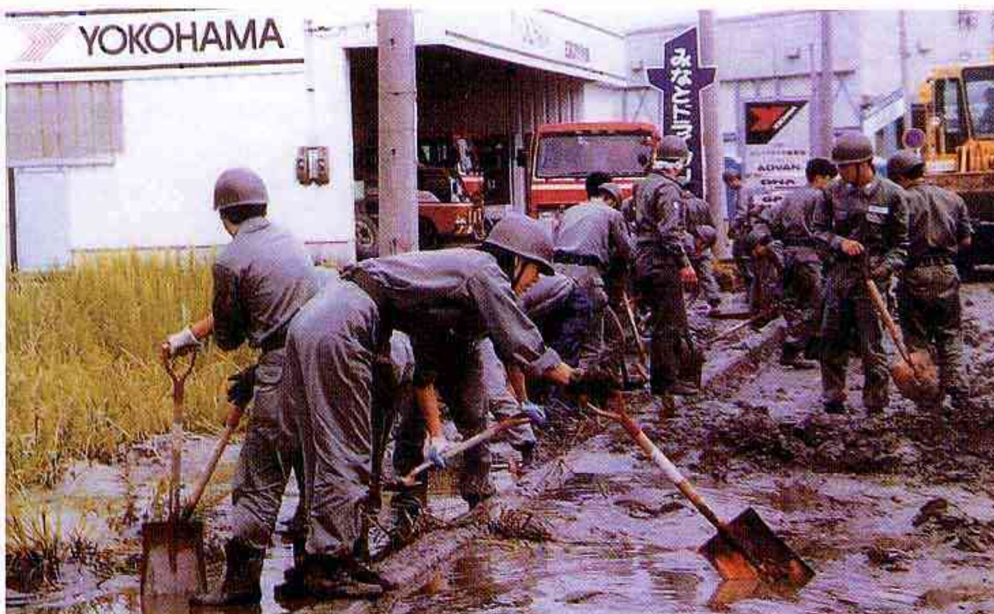
液状化した道路の土砂 を撤去する自衛隊 (境港市)