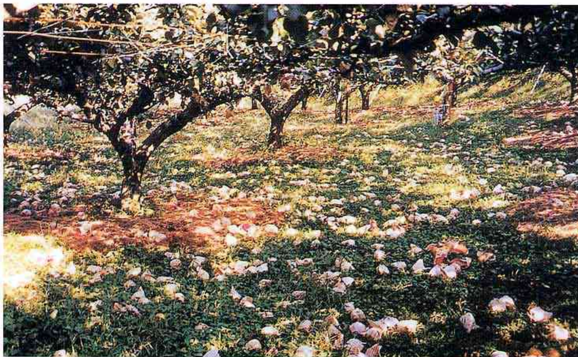
収穫を目前に控えた梨 (新興)の落下(会見町)