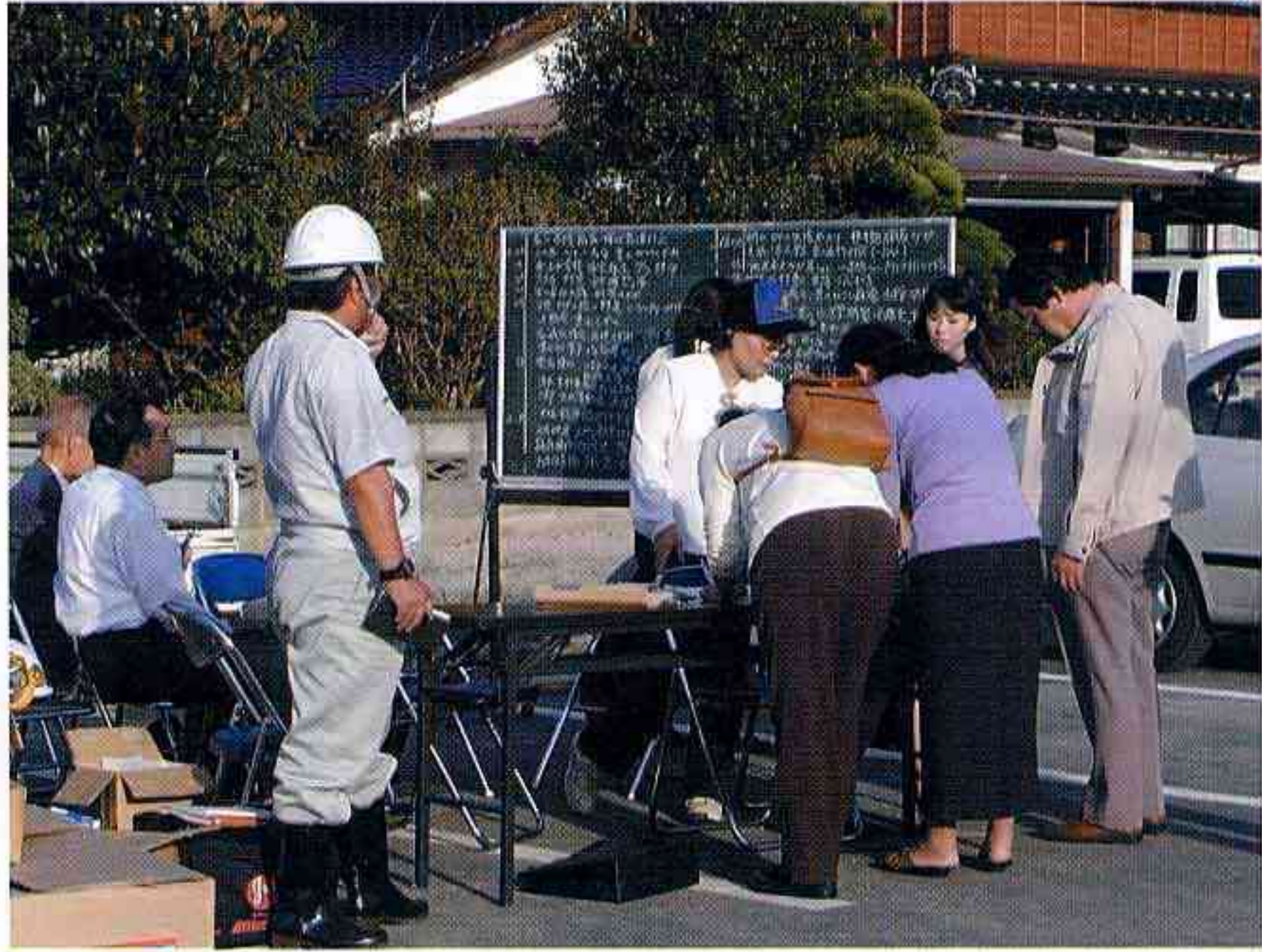
情報収集にあたる溝口町職員