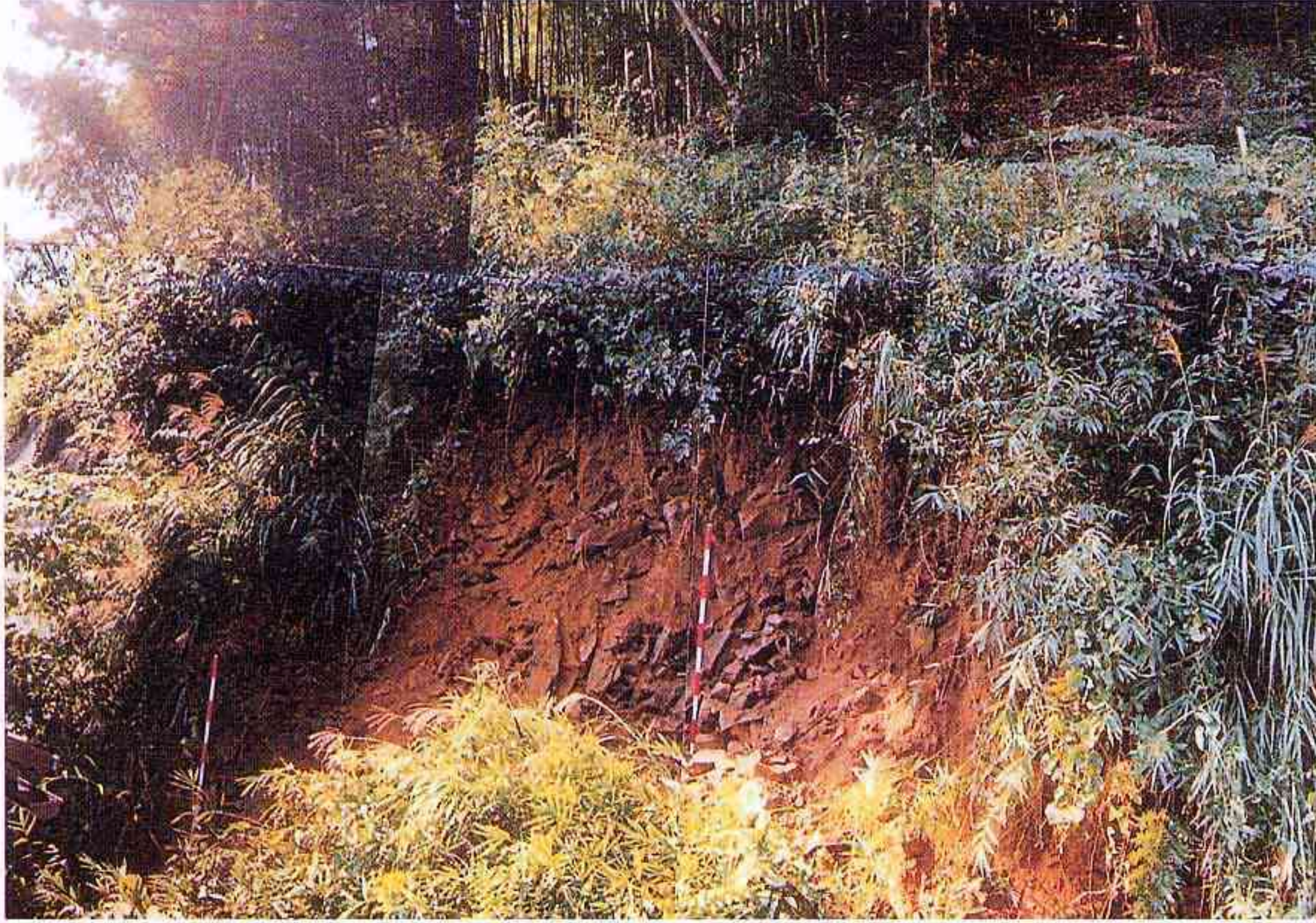
住宅の裏山の崩落（西伯町）