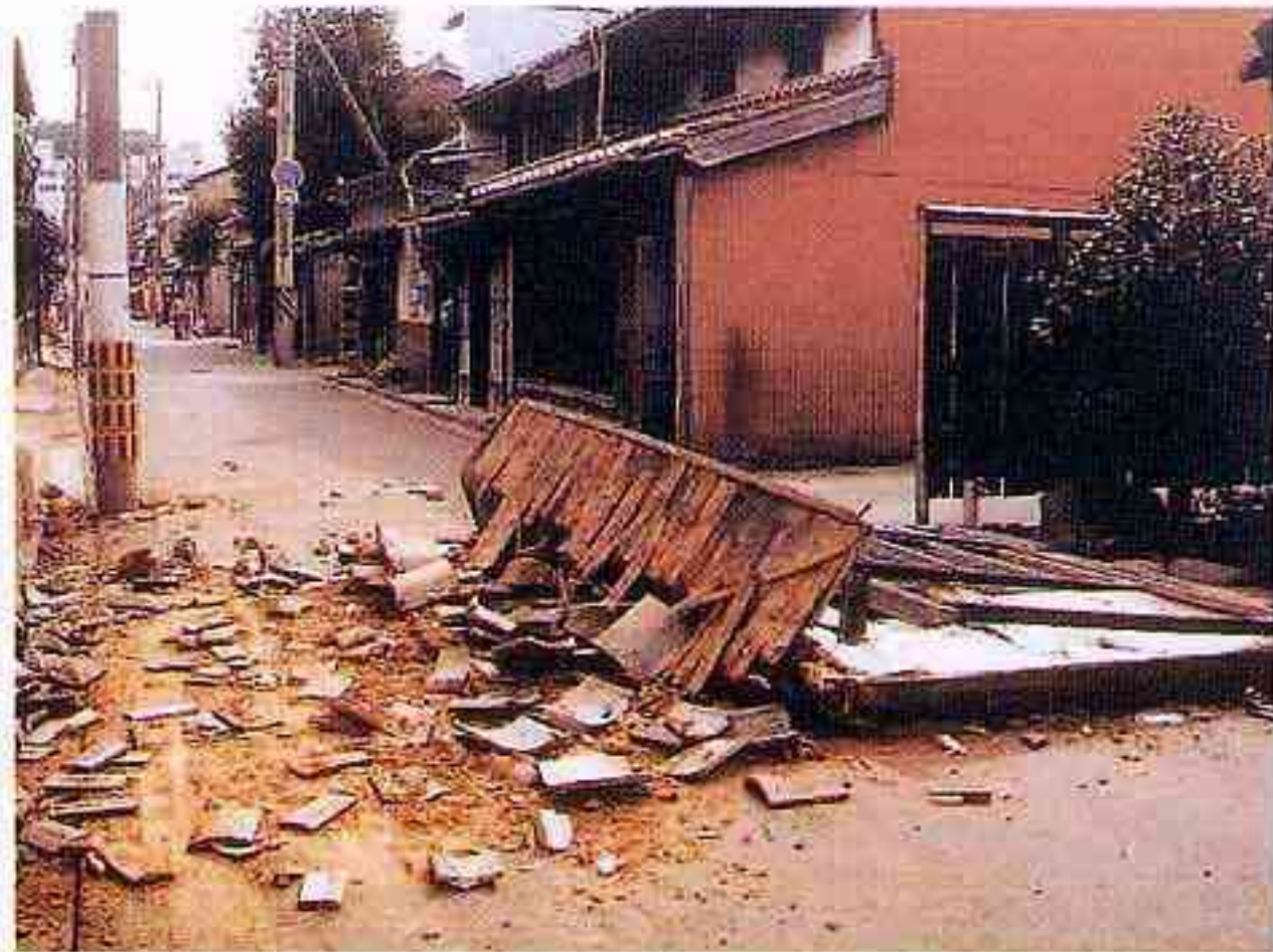
国指定重要文化財 後藤家住宅 蔵の壁の剥落、土壁の崩壊（米子市）