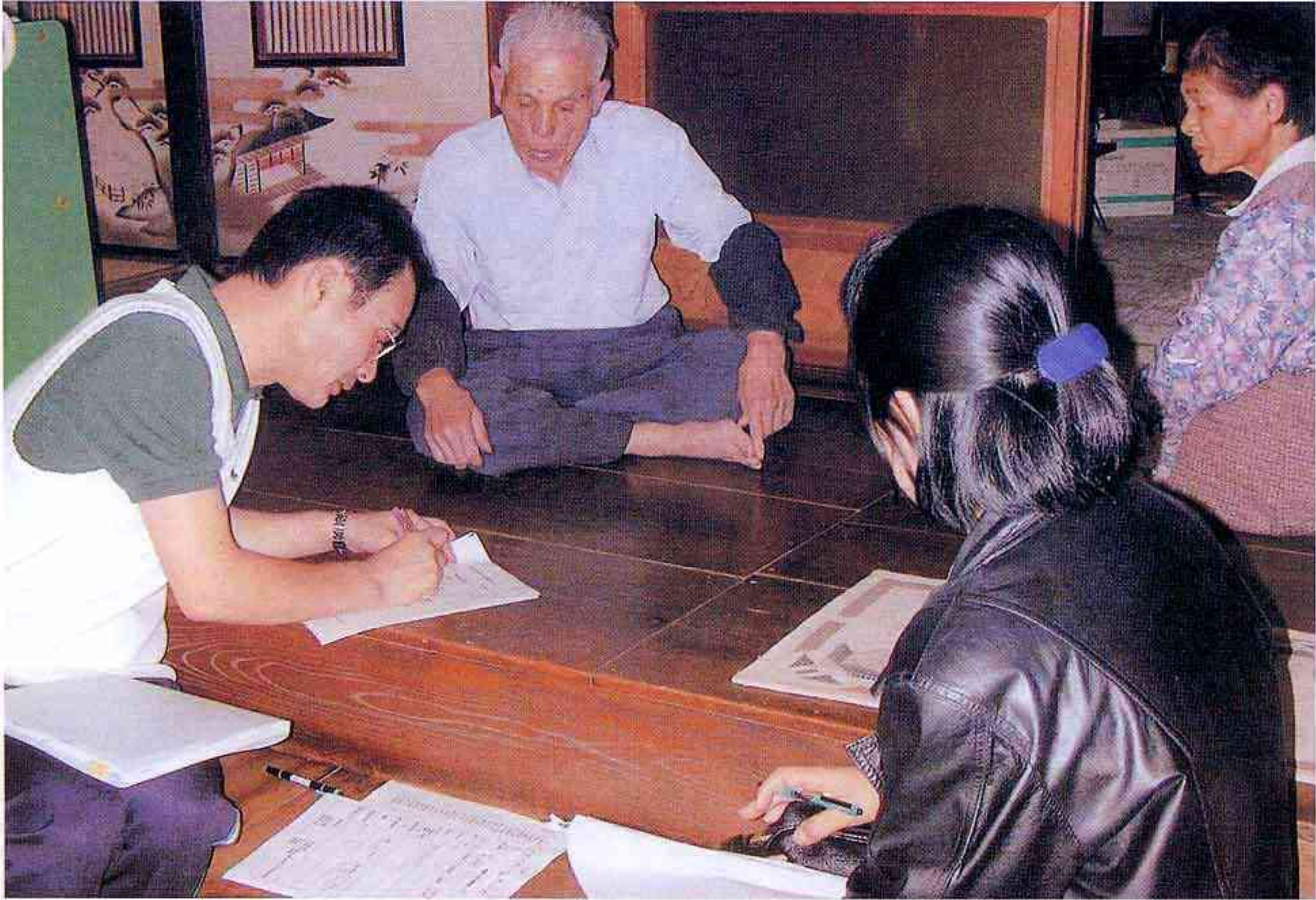
西伯町出前説明会