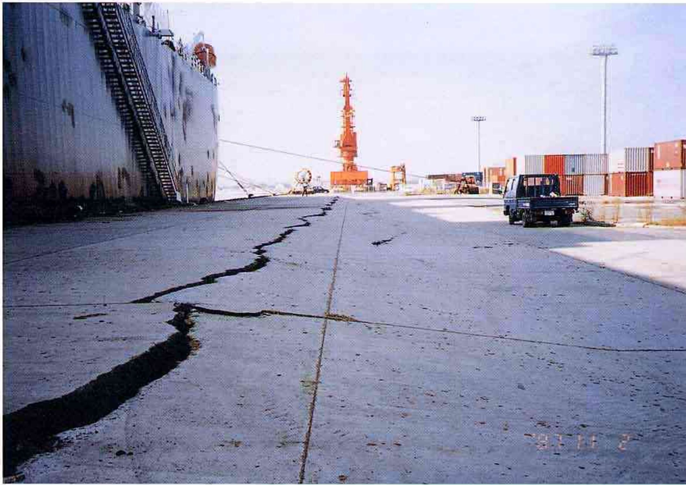
境港 昭和南-13m岸壁の段差