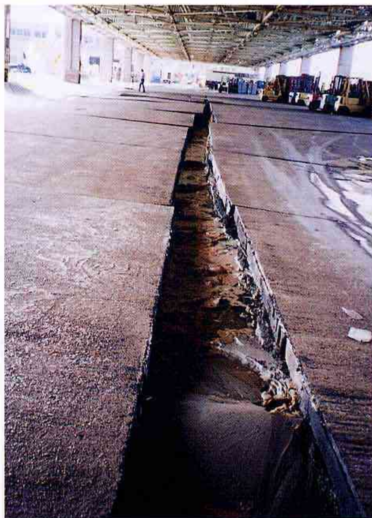
市場内の亀裂（長さ100m、幅0.4m）