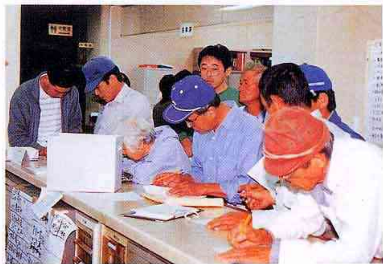
町民からの被害状況や相談を受け付ける職員（西伯町役場）