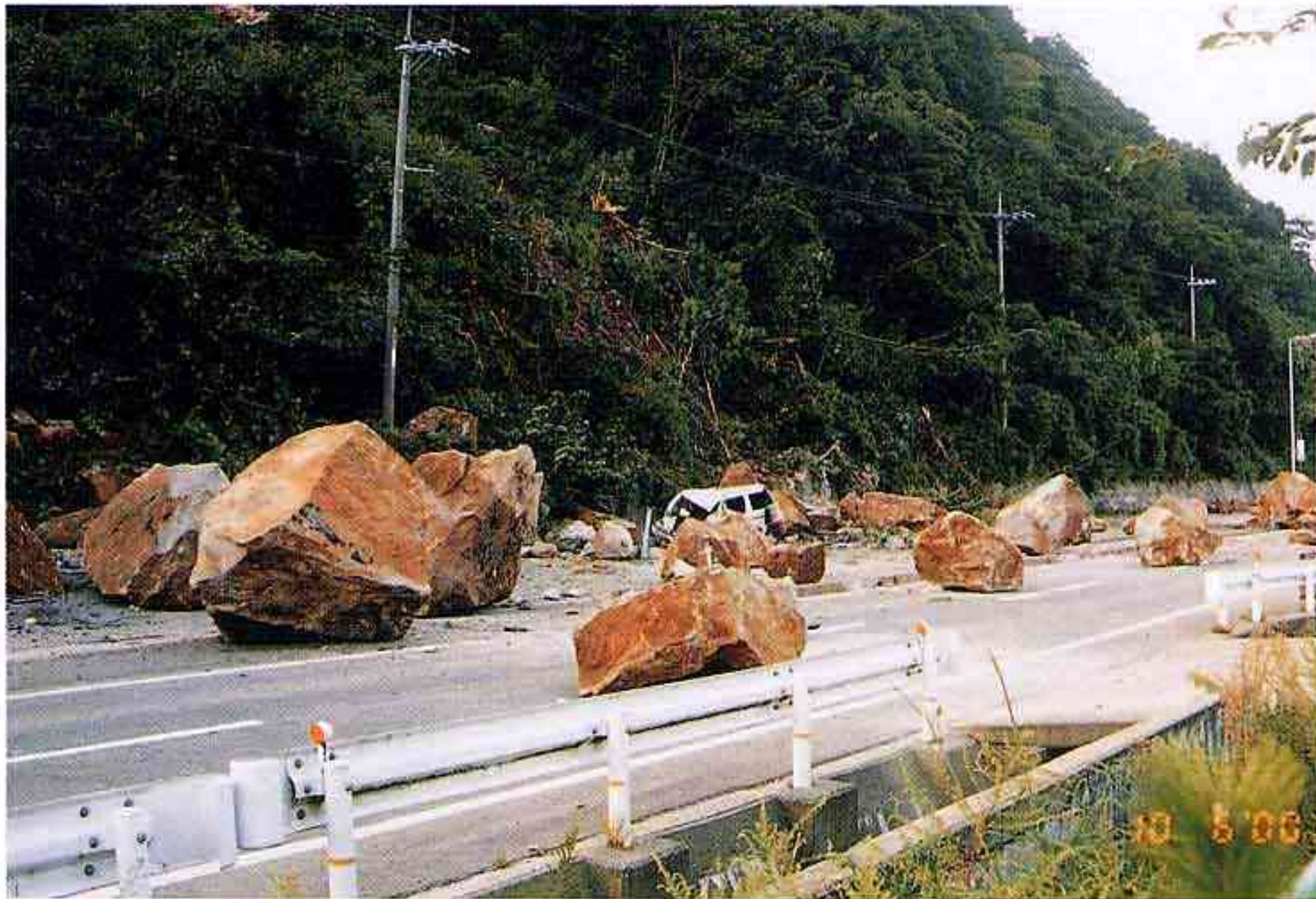
崩落した岩石によりふさがれた県道日野溝口線 停車中の車の運転席・助手席を直撃したが、後部座席にいたため無事であった。