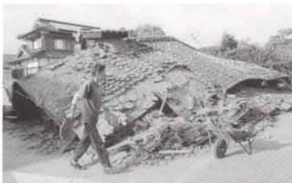
倒壊した米子市内の民家【米子市】