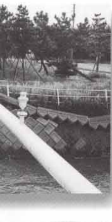
工業用水路の護岸が崩落【境港市】