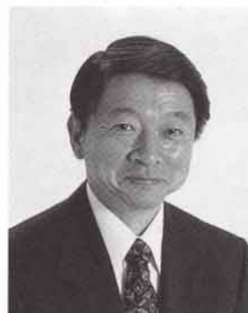
鳥取県知事 片山善博