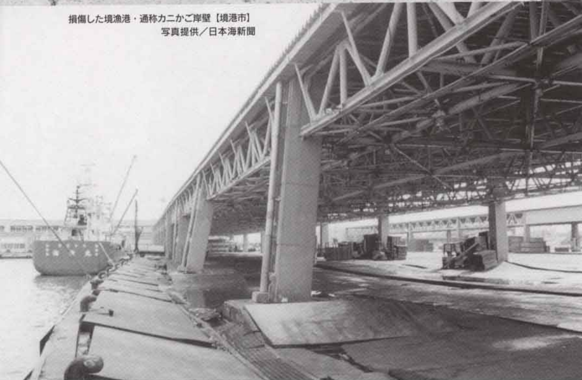
損傷した境漁港・通称カニかご岸壁【境港市】