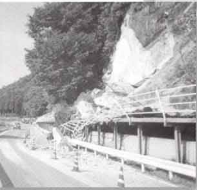
国道180号の法面崩落【日野町小河内】