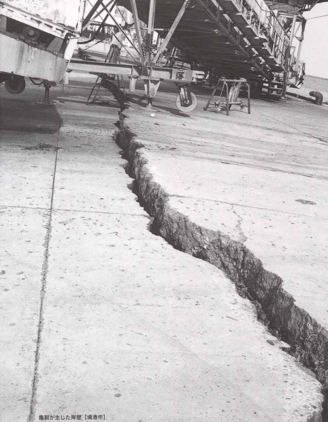
亀裂が生じた岸壁【境港市】