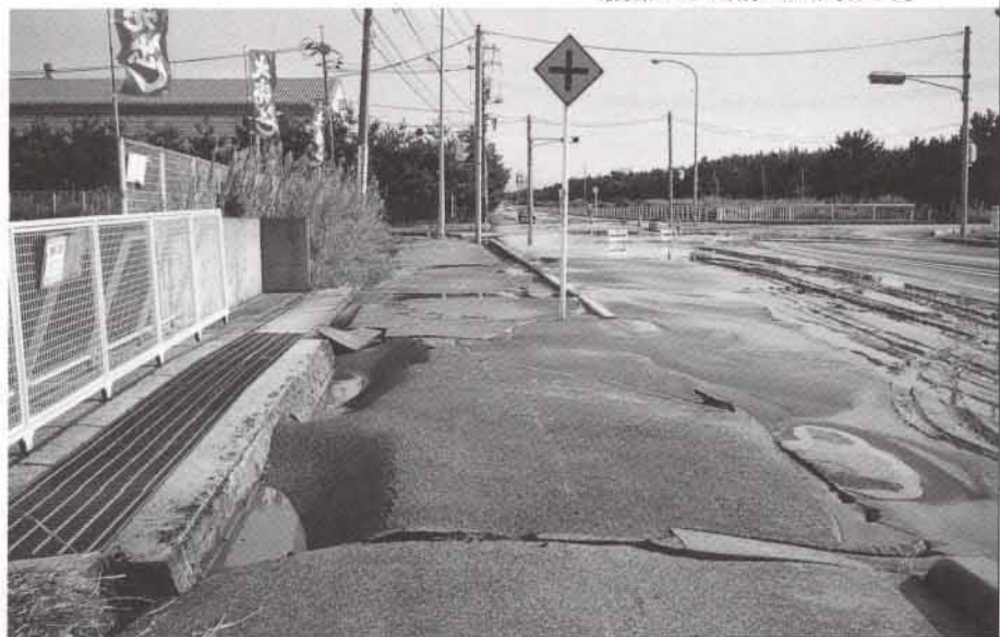
液状化のため波打つ道路【境港市】