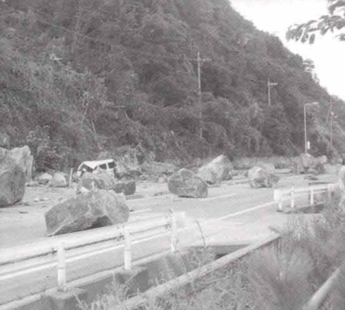
路上に落石(車両を直撃)【溝口町中祖】