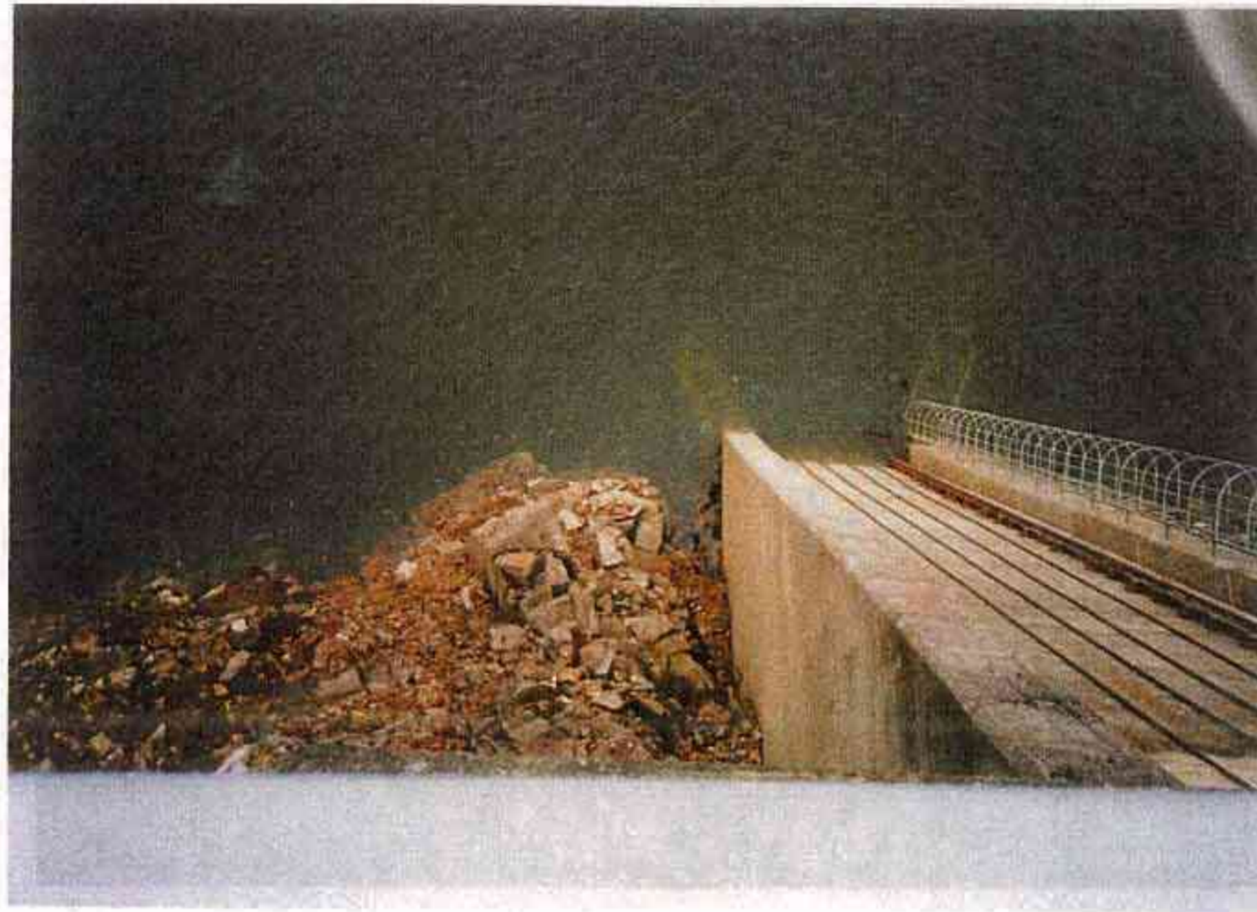
1 日野川第一(発) 取水口