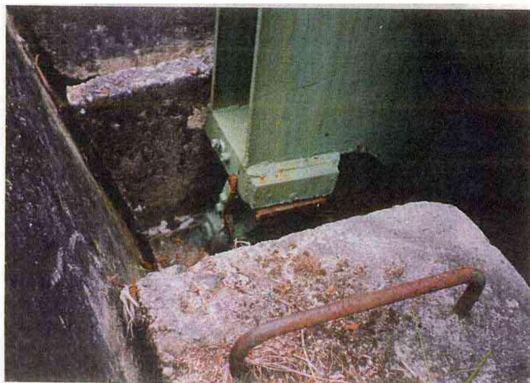
第1～第2固定台 右側 ロッカー支承