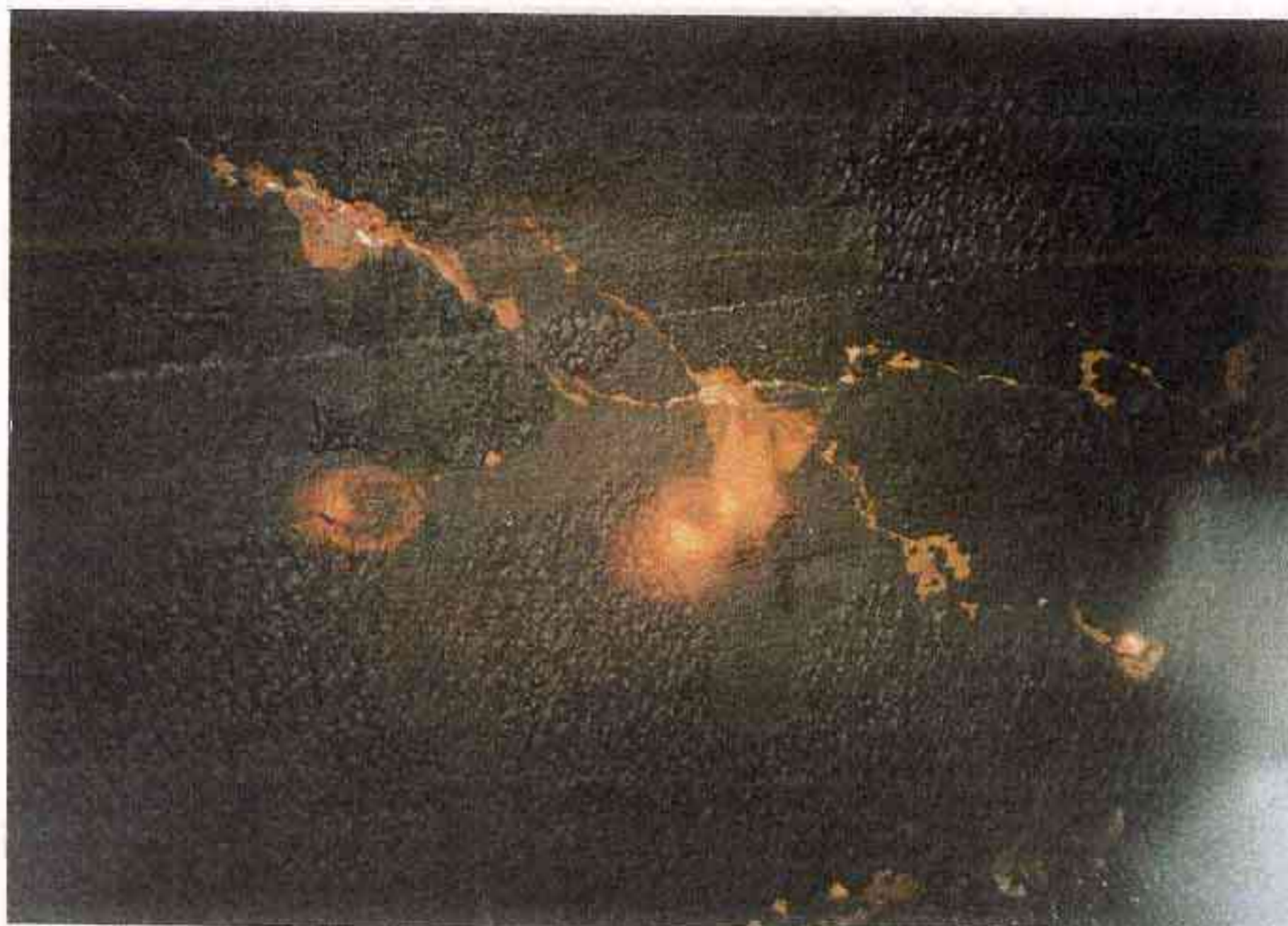
3 同上 左右側壁 位置:1740m 付近