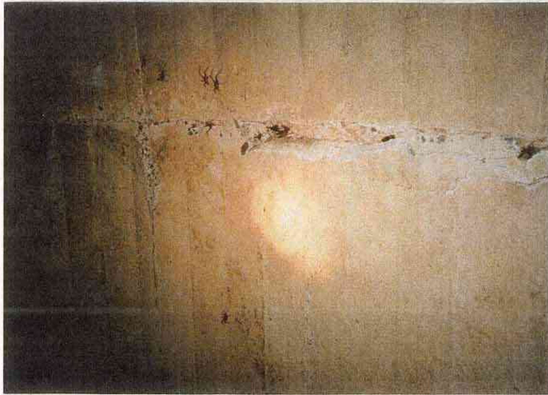
NO. 6 日野川第一(発) 監査用トンネル 目地切れ アーチ部