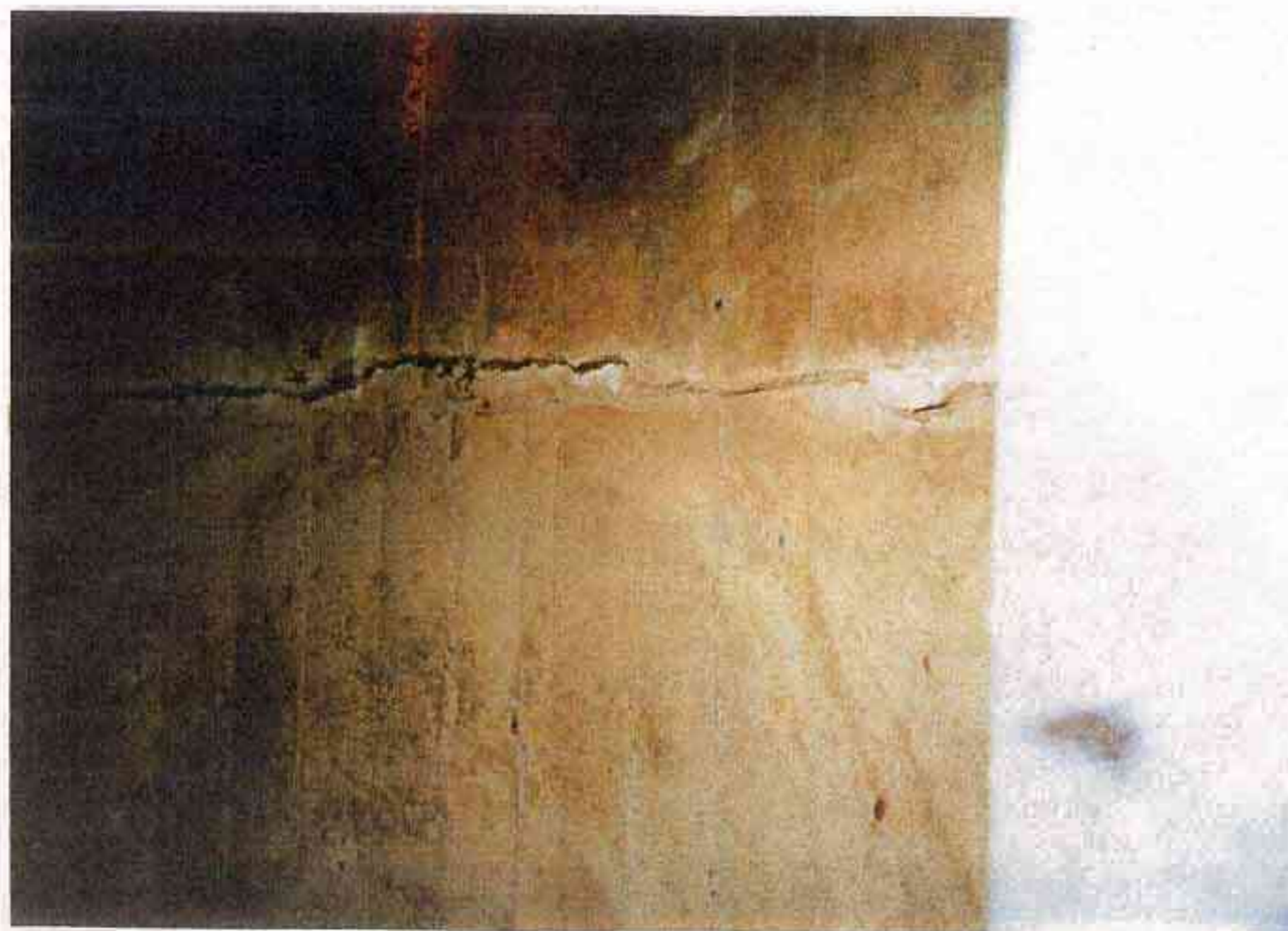
8 同上 監査用トンネル アーチ部 目地切れ 幅:5mm