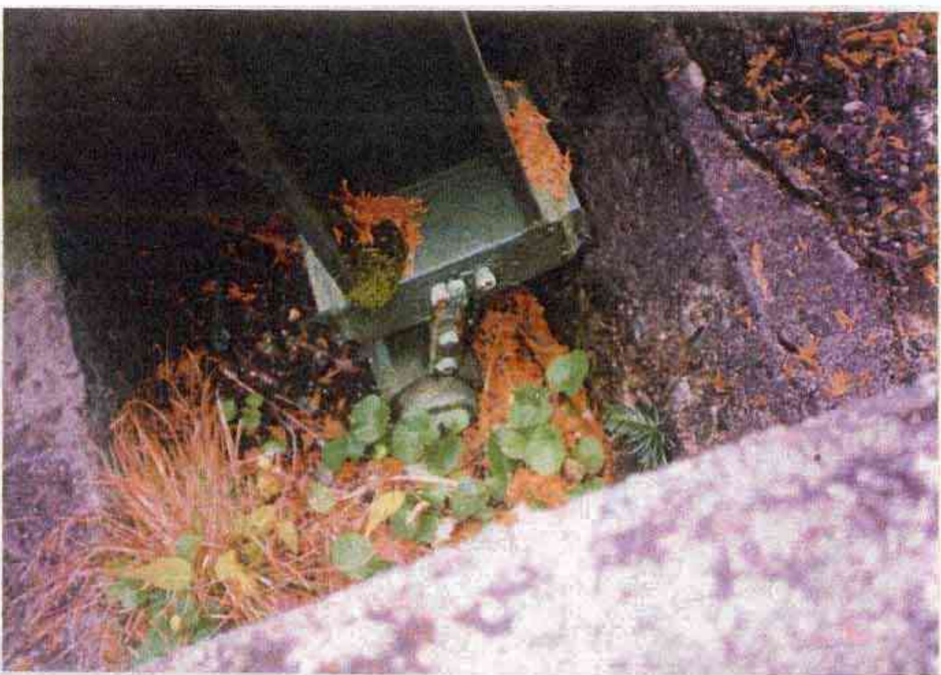
29 第1~第2固定台 左側 凹凸力一支承