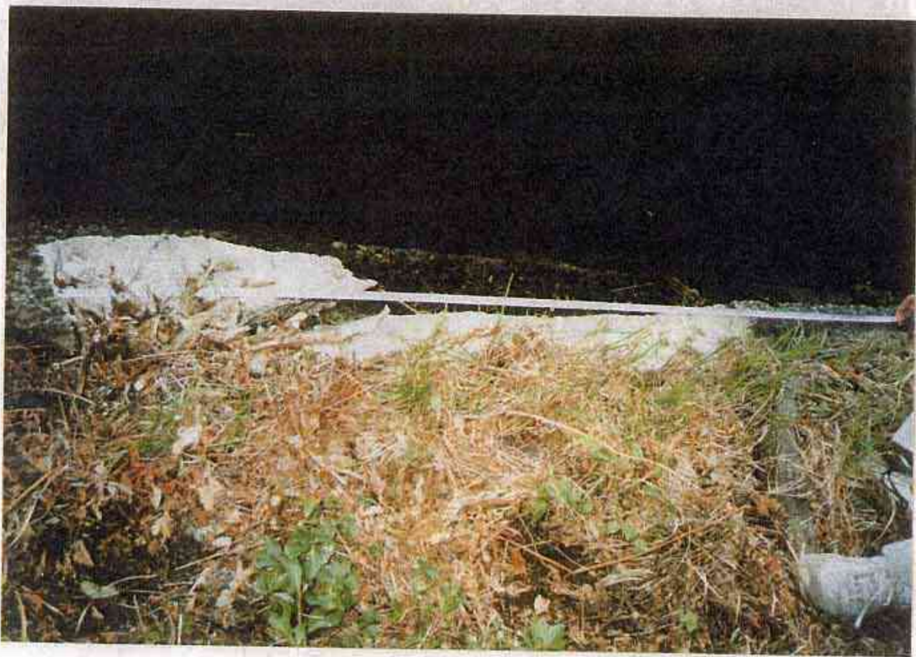
28 第1~第2固定台 左側擁壁 破損状況