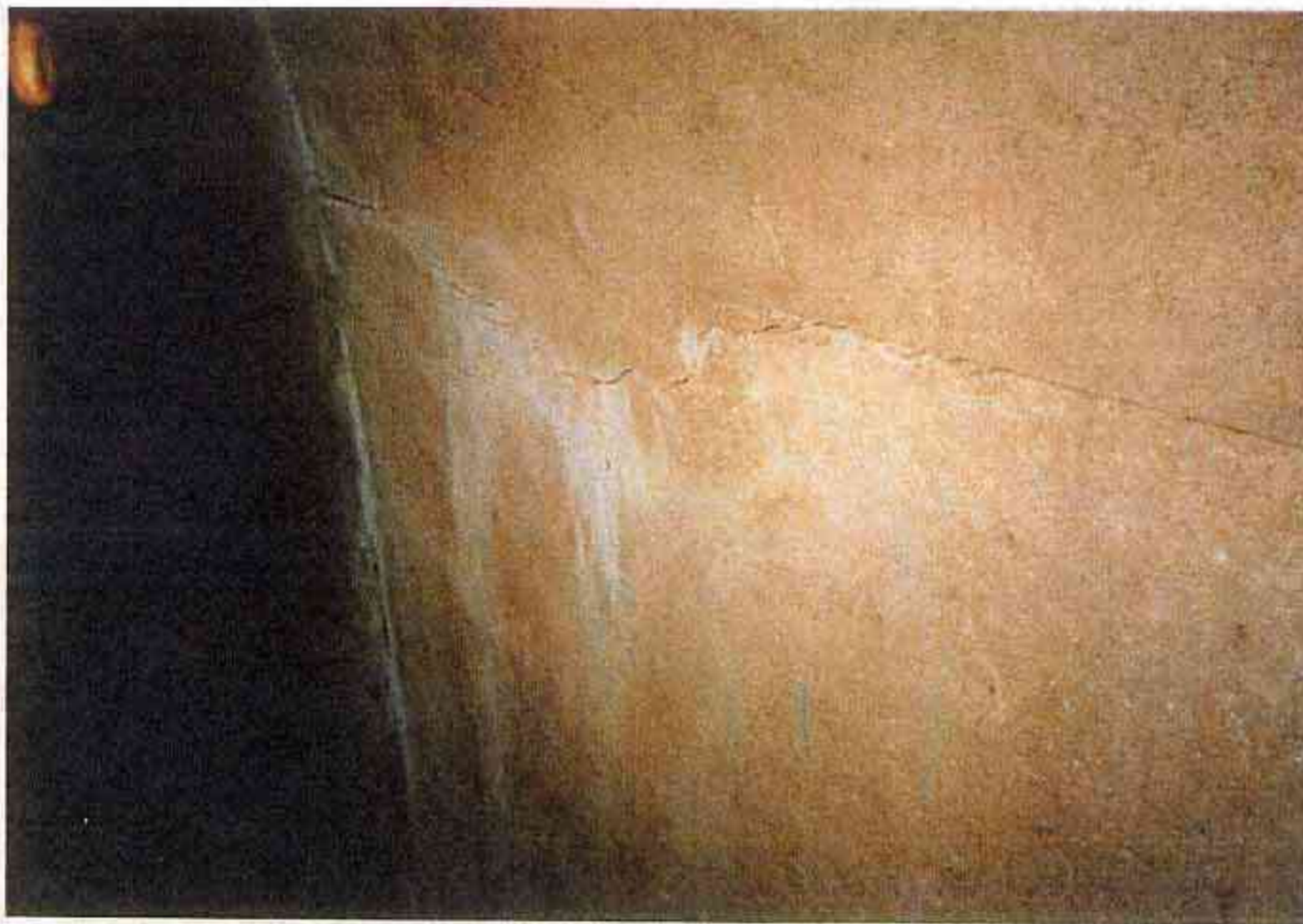
7 同上 監査用トンネル 左側壁 クラック