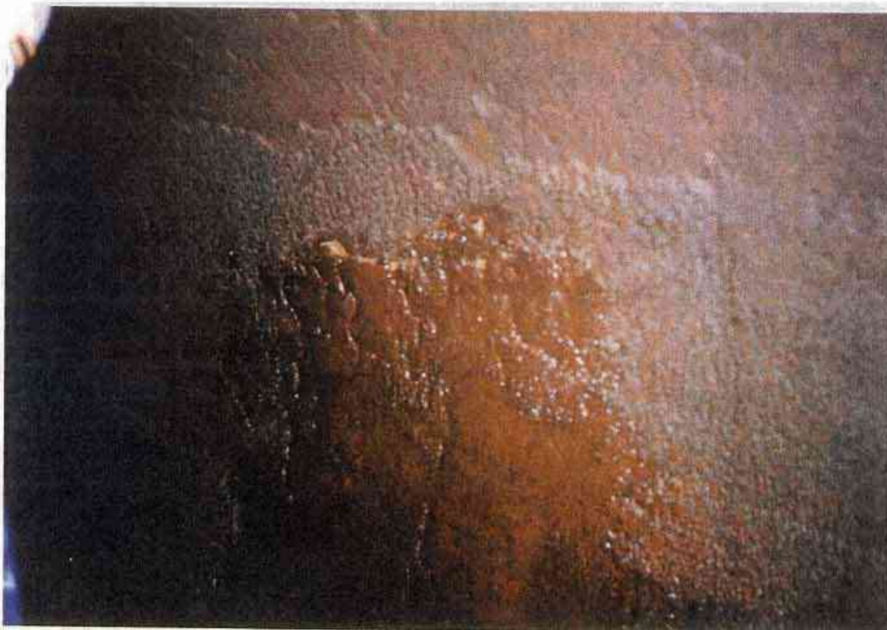
2 同上 左側壁 位置:850m 付近