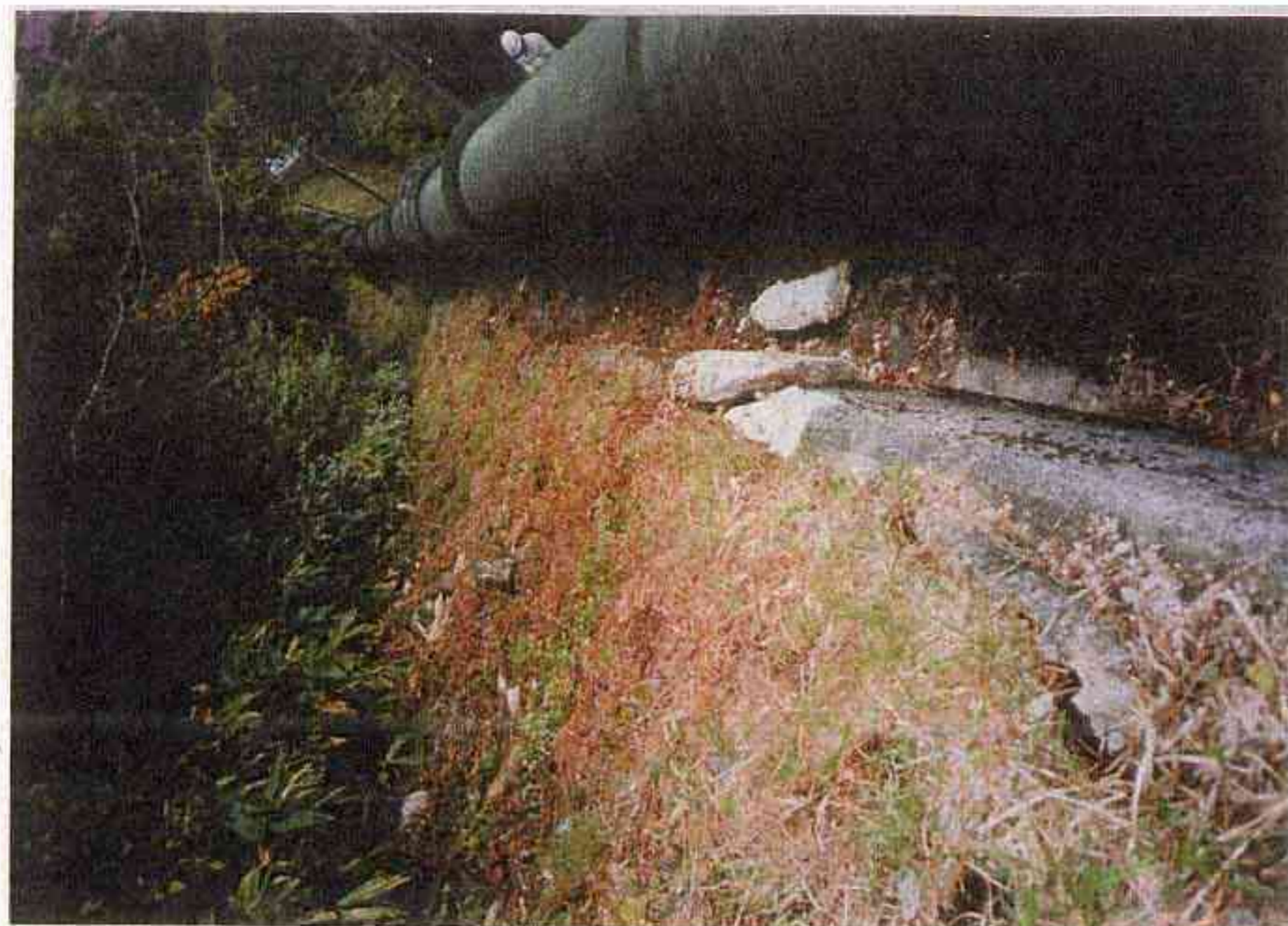
27 第1~第2固定台 左側下流方向