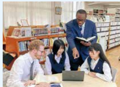
▲放課後の図書館イメージ