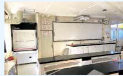
▲化学室(左に見えるのが換気装置)