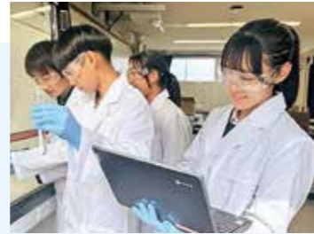
▲化学の実験イメージ

20名を選抜 (学力の定着状況や学校生活の状況等をもとに総合的に判断し決定します)