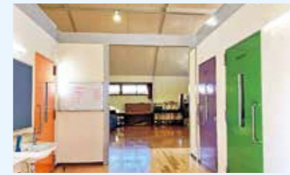
▲創作交流ホール(B音楽室)