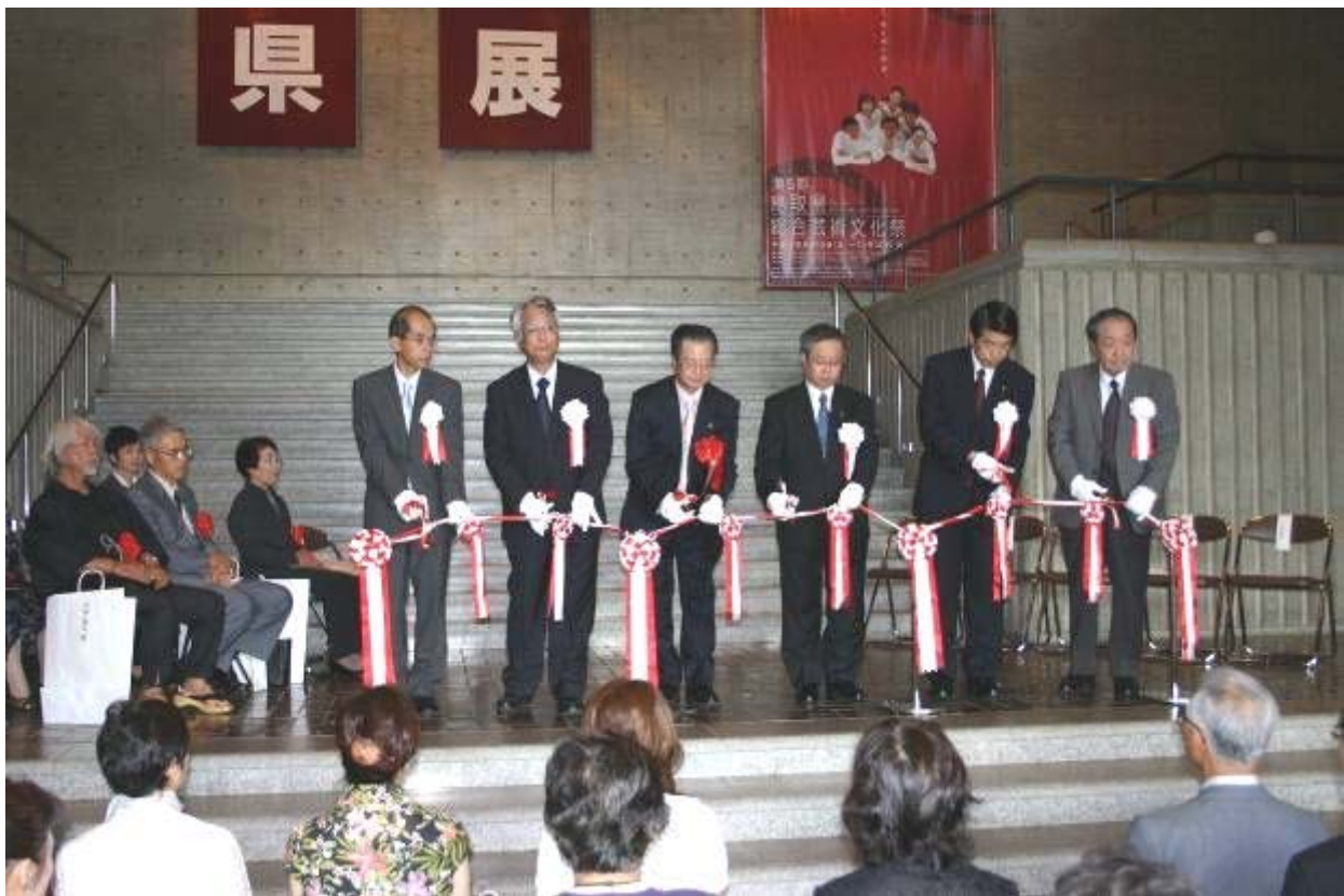
第51回鳥取県美術展覧会の開幕 テープカット（9月15日、県立博物館）