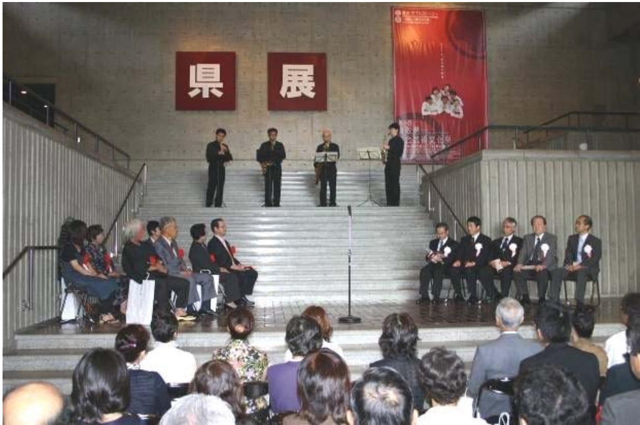
開会式のオープニングアクト 「鳥取サクソフオーンクラブ」の演奏（9月15日、県立博物館）