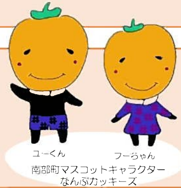
コーくん フーちゃん 南部町マスコットキャラクター なんぶカッキーズ

事業箇所： 西伯郡南部町境 整備延長： 1,000m 道路幅員： 6.0(9.75)m 事業期間： 平成21年度～平成29年度 事業費： 約9億円