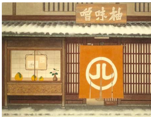
前田直衛《京の老舗（柚屋）》