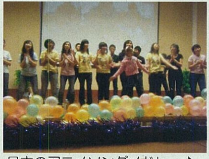
日本のアニメソングメドレー♪