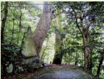
カゴノキ(クスノキ科)

茂宇気神社の社叢を含むこの地域は、スダジイ、ウラジロガシ、タブノキなどの巨樹が優占する極相林です。林内には、暖帯性で、県内では比較的希少なカゴノキなども混在し、優れた自然環境を形成しています。