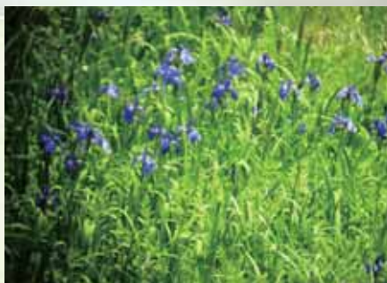
唐川湿原に群生するカキツバタ