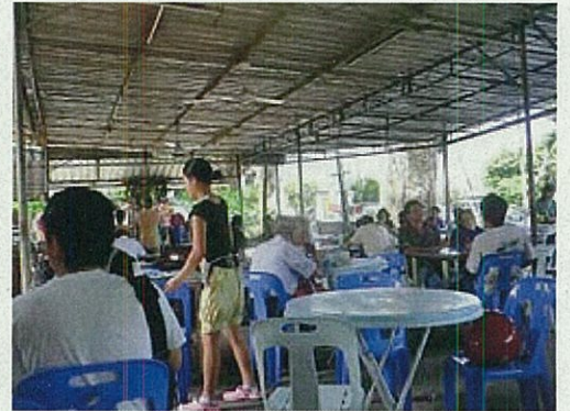
↑ ホーカーセンター

ペナンは、「食の都」とも呼ばれており、至る所にレストラン、屋台やホーカーセンター（複数の屋台が集まっているところ）があつて、各国料理や現地の料理が食べられます。特に現地の料理は料金もとても安く、名物のホッケンミー（福建麵）などを180円くらいで食べることができます。物価は非常に安いですが、日本製の食品などは日本の1.5～2倍程度になりますので、現地のものに比べてとても高価に感じますが、手に入れることはできます。