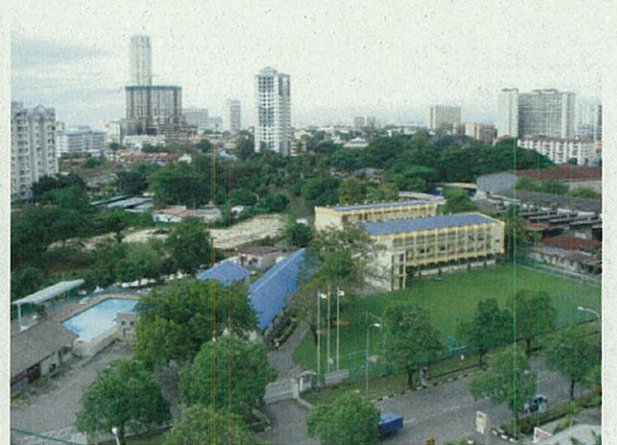
↑ ペナン日本人学校