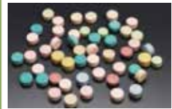
合成麻薬 (エクスタシー、パツ)