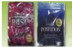
危険ドラッグ …など

もっと怖いのは大麻を使って いるうちに さらに 他の薬物にも手を出す ようになる 危険があるのよ 他の薬物って 覚醒剤とかですか？