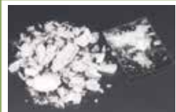
覚醒剤 (シャブ、スピード)