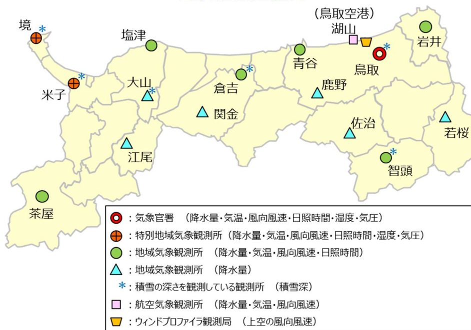
気象観測所配置図