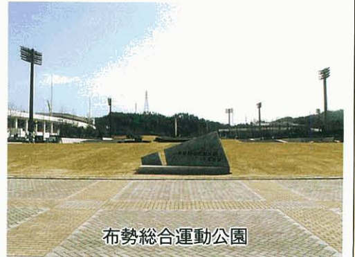
布勢総合運動公園