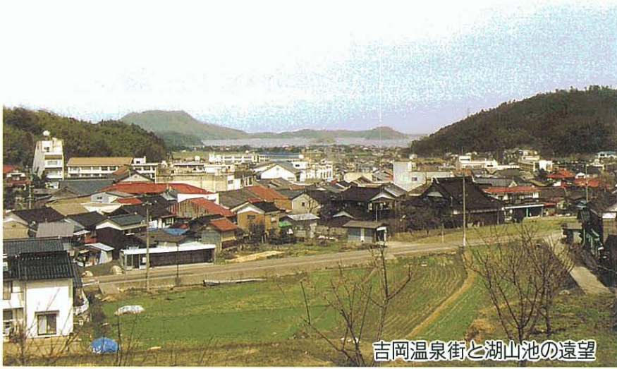
吉岡温泉街と湖山池の遠望