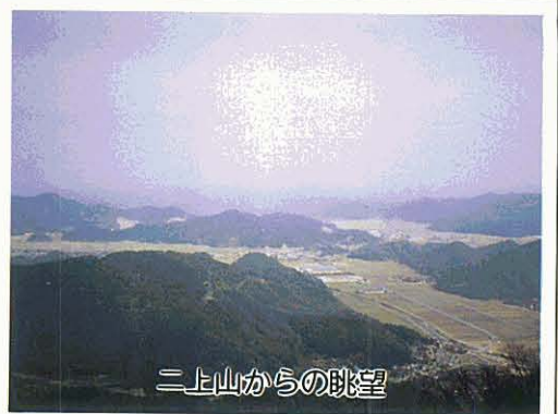
二上山からの眺望