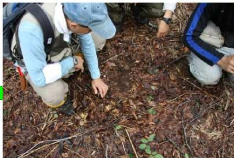
②手作業で落ち葉を 掻き取ります