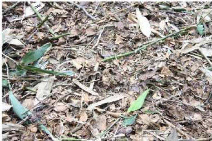
①ササを刈り払った状態