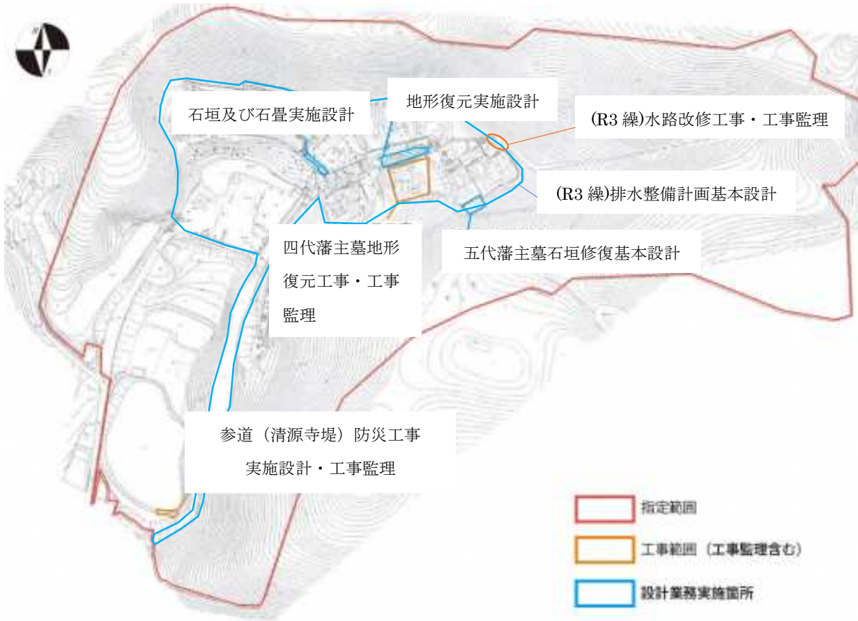
令和3年度繰越し及び令和4年度事業実施箇所