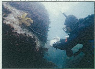
漁業者による藻場造成活動