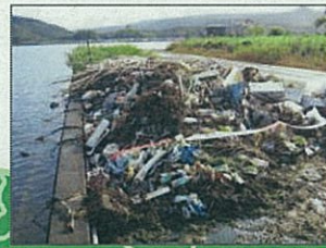
東郷池クリーンアップ