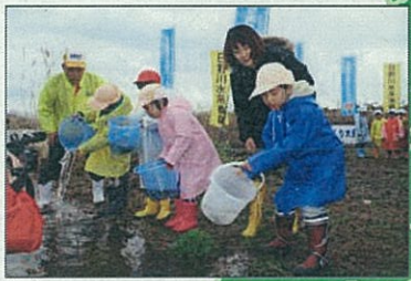
川でのリレー放流