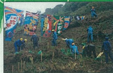
漁業者による植林(魚付き保安林)