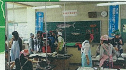
水産課出前授業(魚食普及、調理実習)

平成23年は「うさぎ年」です。そして鳥取県には、白兔海岸の大国主命と白うさぎの伝説を始め、県内各地に「白うさぎ」伝説があります。 今回の大会では、海を渡って来た白うさぎの伝説にちなんで、大会を契機とした「ふるさとの森・川・海を守り育てる」運動に参加した人々を「白うさぎ大使」と命名し、県民総参加による新たな国造り運動を展開していきます。 「白うさぎ大使」は、国造りを行った大国主命を八上姫に引き合わせた幸せを運ぶうさぎにちなんでいます。