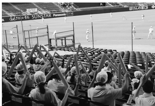
夏の甲子園2大会連続出場