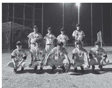
【県定通高校総体】 軟式野球

4月から9月までが前期、10月から3月までが後期の2学期制です。定められた単位を修得すれば9月卒業も可能です。