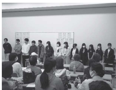
【2年次生関西研修】 （夜間中学との交流）