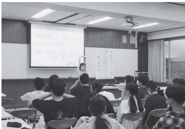
【キャリアアップ講座（進路講演会）】

鳥取大学、神戸学院大学、長崎国際大学、鳥取短期大学、大阪アニメーションカレッジ専門学校、大阪デザイナー専門学校、中山精工、ENEOSウイング、東宝企業、マルイ、万翠楼、日清医療食品株式会社