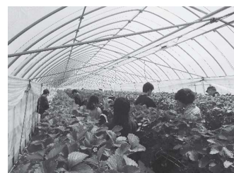
【4月校外研修】 （いちごの収穫体験） 北栄ドリーム農園