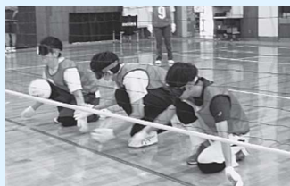
フロアバレーボール

行事は小・中・高等部及び専攻科理療科の幅広い年齢層の児童生徒が、教職員と一体となって助け合いながら活動します。校内弁論大会の優勝者は中四国地区盲学校弁論大会に出場します。