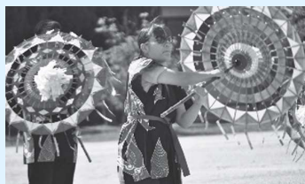
体育祭（傘踊り、タイヤ取り物語の様子）