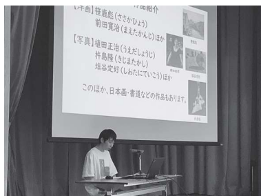
「とりようわくわくフェスタ」

学級やコースごとなど、それぞれのねらいに合わせて行事を行います。実体験を重視し、校外学習も設定しています。