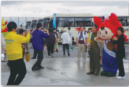
東北からのお客様を温かくお出迎え。