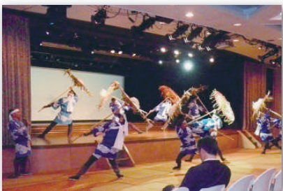
出港行事は、船内で勇壮な「因幡の傘踊り」、賀露小学校の可愛らしい合奏を披露。