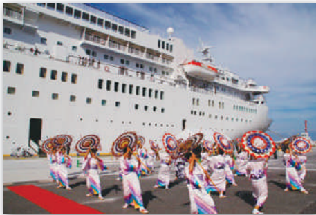
しゃんしゃん傘踊りで華やかにお出迎え。

当日は、鳥取港クルーズ誘致推進会議が中心となって歓迎セレモニー等を実施。岸壁での郷土芸能の披露、特産品販売・試食、足湯の提供など、鳥取港ならではの趣向により、クルーズのお客様をおもてなしました。