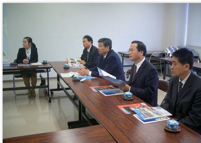
鳥取港の説明等を熱心に聞かれました