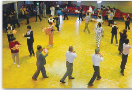
体験クルーズは、船内での楽しいイベントで盛り上がりました。