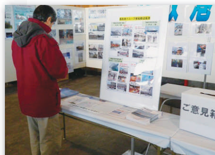
鳥取港振興会も展示を実施