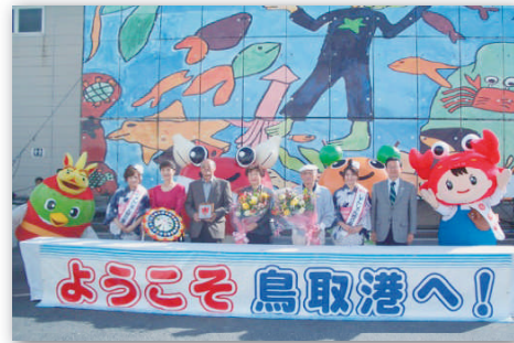
乗客代表の皆様と記念写真。ゆるキャラたちもお出迎え。