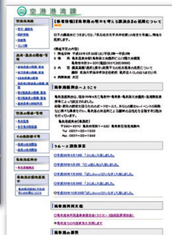
公式HPトップページ

http://www.pref.tottori.lg.jp/dd.aspx?menuid=148404 (検索サイトから「鳥取港振興会」で検索できます)