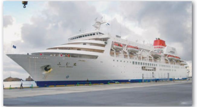
早朝午前6時30分頃、ふじ丸入港。

当日は、早朝に鳥取港に到着。その後、東北地方を中心にした約350名の乗客は、鳥取・島根の観光へと出発されました。入れ替わりに、県民の方を対象にした鳥取から境港までの体験ランチクルーズが行われ、約150名の県民の皆様が参加。当日はあいにくの雨天でしたが、参加者はひとときの豪華なクルーズ客船の旅を満喫されていました。