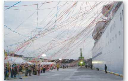
紙テープによる感動のお見送り。またの来港をお待ちしています。