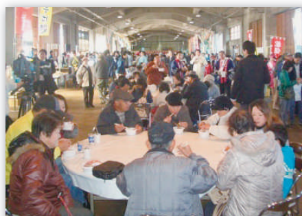
会場は毎年大賑わいです

平成22年11月27日(土)、県漁協内で、恒例の「鳥取かにフェスタ2010」が行われました。当日は、松葉がにをはじめ新鮮な魚介類が格安で販売され、会場は県内外からつめかけた大勢の人たちでにぎわいました。鳥取港振興会もクルーズ誘致の取組みをパネル展示で紹介しました。