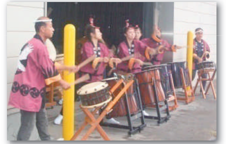
体験ランチクルーズを鷲峰太鼓でお見送り。