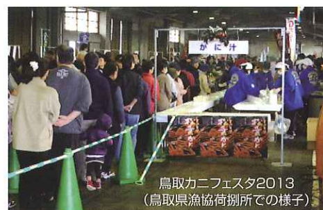
鳥取かにフェスタ2013 (鳥取県漁協荷捌所での様子)

秋の鳥取港での2大イベント(「鳥取かにフェスタ2013(H25.11.16(土))」&「第2回食のみやこ大漁収穫感謝祭」(H25.11.23(土)～24(日))が、天候にも恵まれる中、鳥取港マリニピア賀露周辺で2週連続で開催されました。地元で水揚げされた「松葉かに」を始め、新鮮な魚介類・野菜が格安で販売されたほか、郷土芸能やクイズラリー、ゲームなど多彩な催しも行われ、冬の海・山の幸を求める県内外の行楽客・家族連れで賑わいました。長蛇の列が出来る一番人気の「かに汁」無料配付では、両イベントあわせて、2200食がふるまわれました。