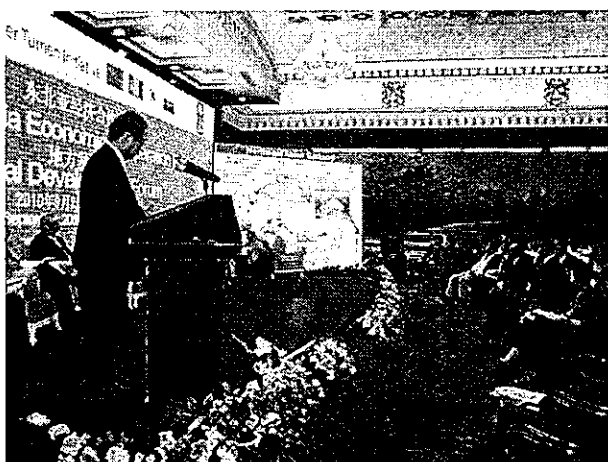
G T I 地方発展フォーラム (9月2日) での副知事スピーチの様子