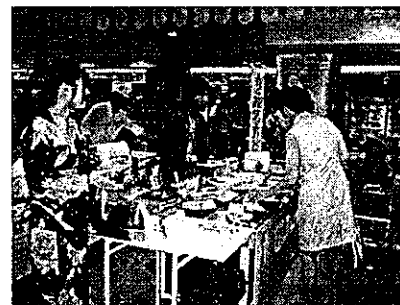
物産展会場の様子