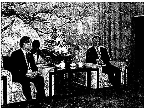
王儒林吉林省長表敬 (9月1日)