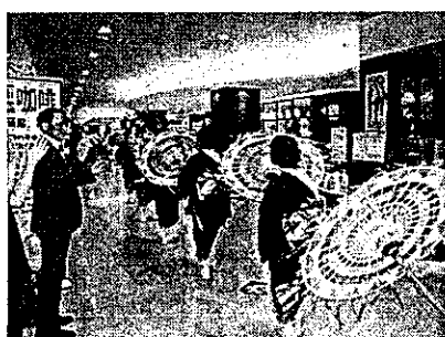
しゃんしゃん傘踊りを披露する鳥取市観光協会連の皆さん（8月21日）