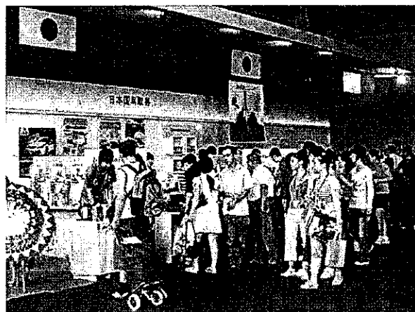
鳥取県出展ブースの様子