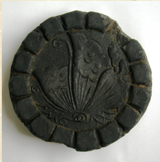
鳥取池田家西館家紋瓦