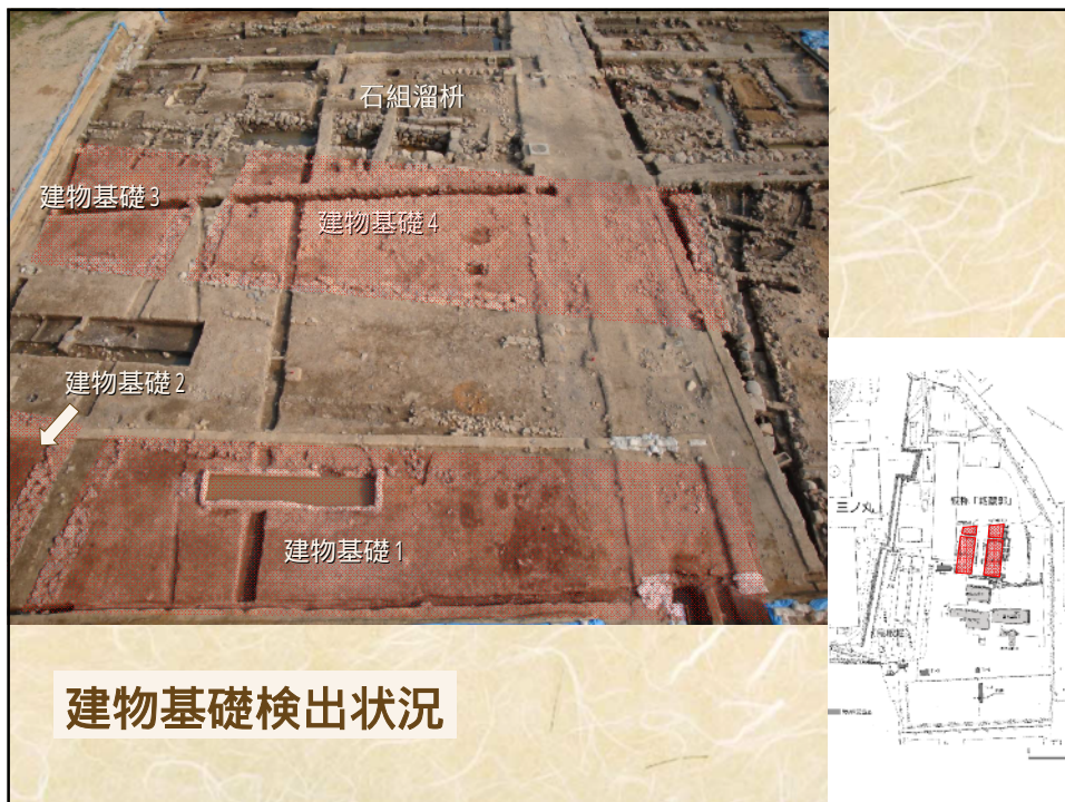
建物基礎検出状況