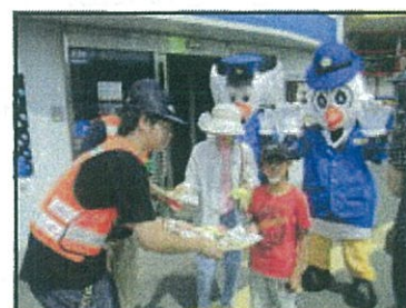
(大学生ボランティアとの活動状況)