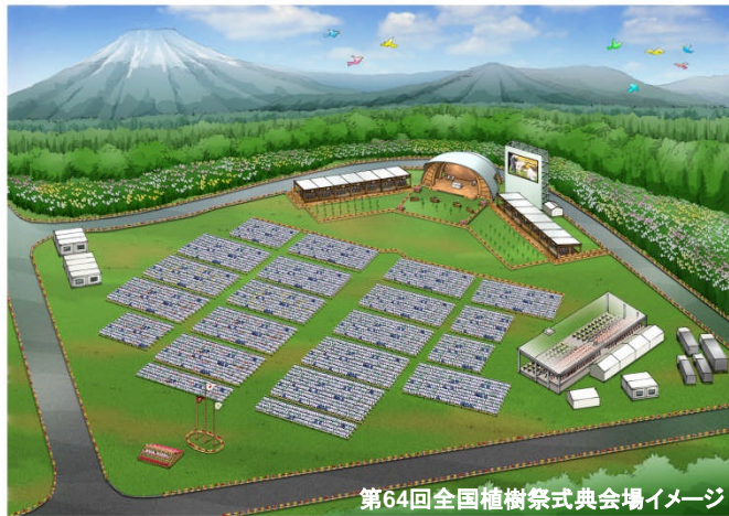
第64回全国植樹祭式典会場イメージ