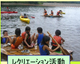
レクリエーション活動

全国植樹祭では、多様なボランティア、子供たちなど多くの県民に参加していただき、また、支えられた大会を目指しています。日ごろから緑を守り育てる活動をしている「みどりの少年団」には様々な場面で参加いただく予定です。