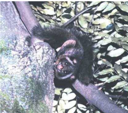
広島市安佐南区 1994.3.21