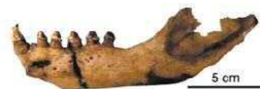
ニホンアシカ下顎骨(青谷町青谷上寺地遺跡)

■ 選定理由 ：鳥取市 あおやかみじち 青谷町青谷上寺地遺跡から下顎骨や前肢の骨などが出土しており，かつて鳥取県に生息していたのは確実である。