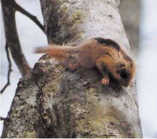
鳥取市国府町扇ノ山 2001.5.4

■ 選定理由 ：近年の確認記録が県東部の山地森林に限定され、生息適地の減少も懸念される。