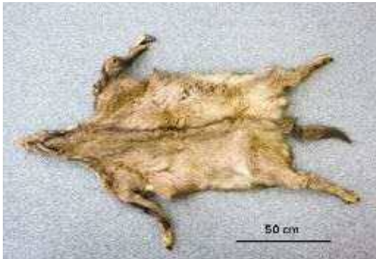
明治時代に八頭郡若桜町で狩猟されたニホンカモシカの毛皮

■ 選定理由 ：鳥取市 あおやかみじち 青谷上寺地遺跡から下顎骨，肩甲骨などが出土しており，明治時代の毛皮が確認されていることから，かつて鳥取県に生息していたのは確実である。