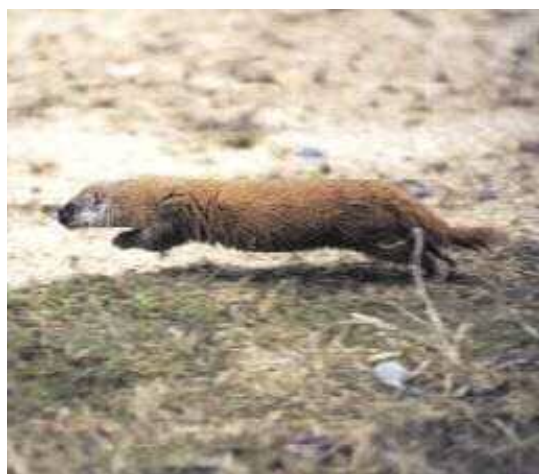
広島県大野町 1996.3.17

■ 選定理由 ：2001年以降、県内での本種の確認報告はない。学術的な調査が行われていないことも未確認の原因の一つと考えられるが、外来種のチョウセンイタチ Mustela sibirica Pallas, 1773の繁殖による本種の生息数減少が現在も続いている可能性がある。