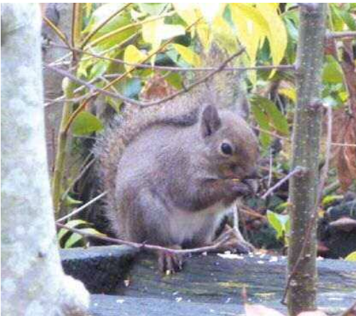
倉吉パークスクエア 三朝町内捕獲個体 2010.3.5

環境省：絶滅のおそれのある地域個体群 (LP) ：“中国地方のニホンリス”で掲載