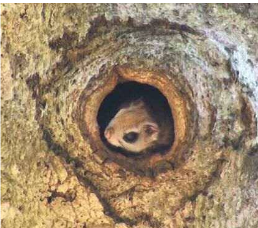
成獣 若桜町春米 2010.11.21