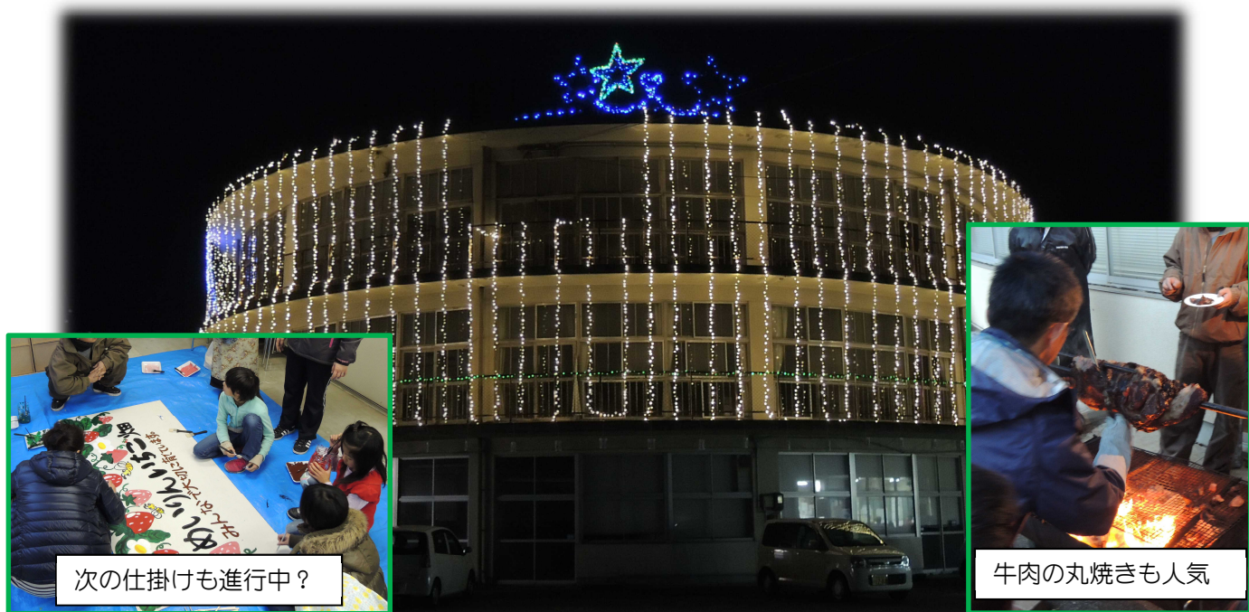
次の仕掛けも進行中?