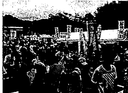
〔ご当地グルメ会場〕