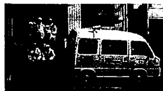
東西町地域振興協議会