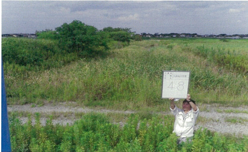
⑦No.64 崎津承水路への排水先状況