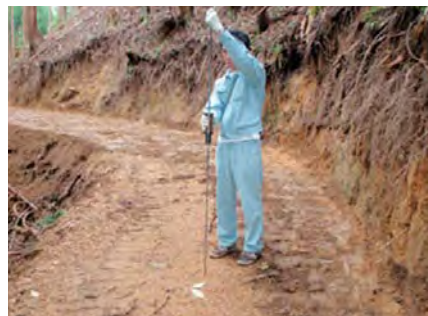
作業道の盛土の締め固めに関して、施工の良否を簡易に検査するための方法を開発