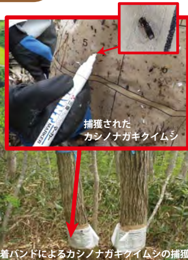
捕獲されたカシノナガキクイムシ