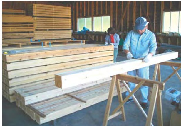
製材工場と協力して低コストで高品質な人工乾燥材生産技術の開発