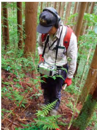
水音を聞いて地面の下を流れる水みちの位置を調べ、山地災害発生の防止に役立つ