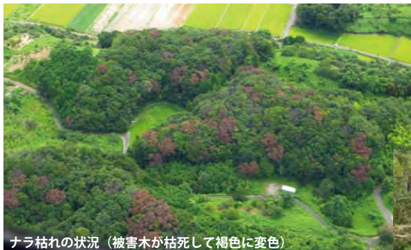
ナラ枯れの状況（被害木が枯死して褐色に変色）