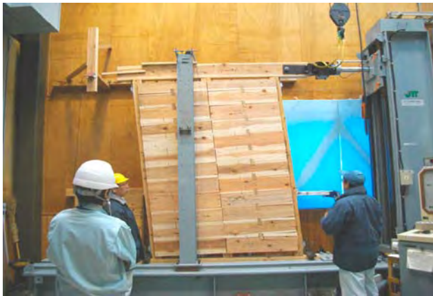
スギの厚板を活用した地震に強い壁や床の開発