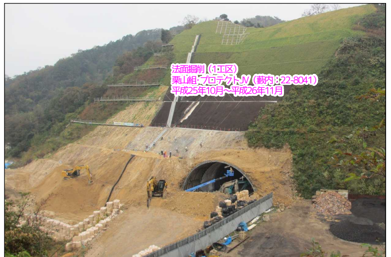
法面掘削(1工区) 栗山組・フタバJV(敷内:22-8041) 平成25年10月~平成26年11月

トンネルが貫通した瞬間です。トンネルの内側から大型ブレーカーで最後の岩盤を破碎しました。