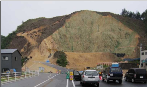
6月頃の大規模土工現場の状況です。

左の写真と比較すれば、大規模土工が概ね半分程度完了したことが確認できます。来年夏頃までには、トンネル坑口部が県道からも見えるようになる予定です。