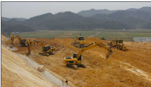
山頂部の掘削現場の状況です。