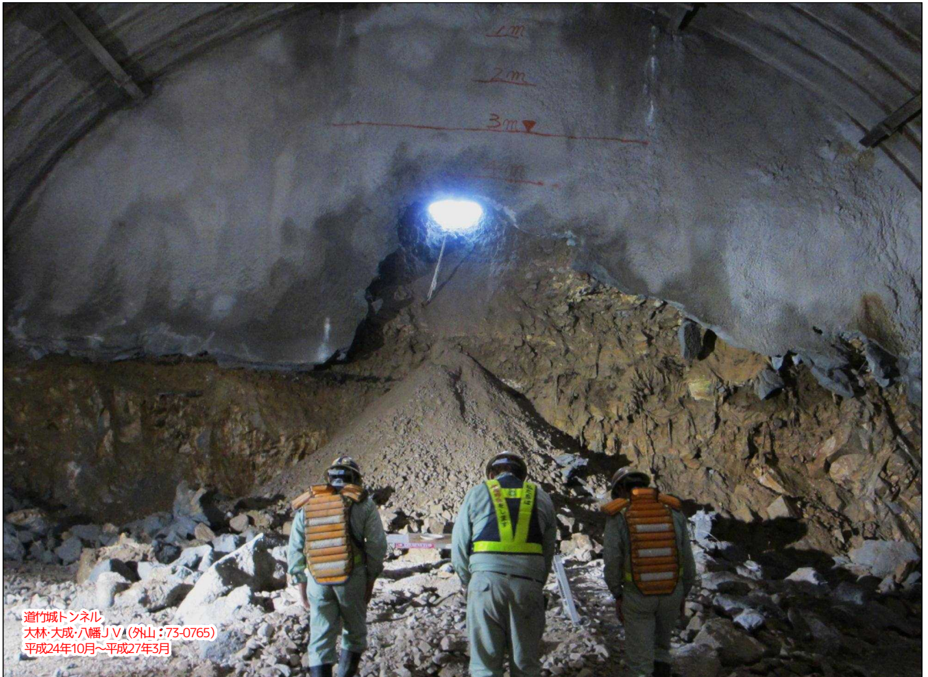
道竹城トンネル 大林・大成・八幡JV(外山:73-0765) 平成24年10月~平成27年3月

岩美道路の岩美ICと浦富ICを結ぶ道竹城トンネル(L=1,187m)が、10月26日13時46分に遂に貫通しました。工事着手から貫通までに実に2年の歳月を要し、地元の皆様方にも大変な御迷惑をお掛けしましたが、本庄側から掘り進めたトンネル内に浦富側の陽が初めて射し込んだ瞬間には、関係者一同、万感の想いが込み上げました。引き続きトンネル内部と坑口部の工事を進め、来年春頃にはトンネル内部の外壁と坑口部(浦富側)が概成する予定です。