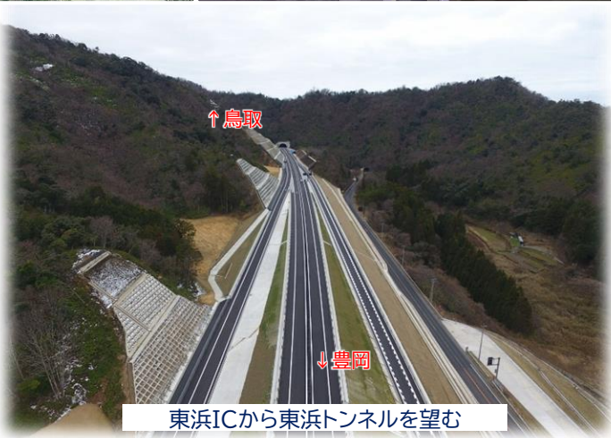
東浜ICから東浜トンネルを望む