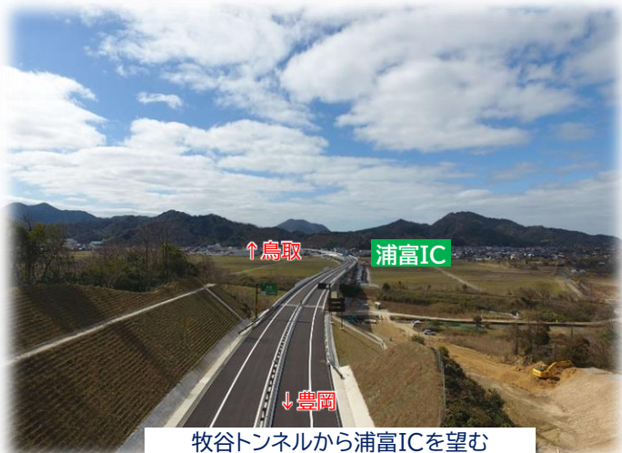
牧谷トンネルから浦富ICを望む