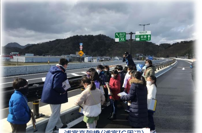
浦富高架橋(浦富IC周辺)