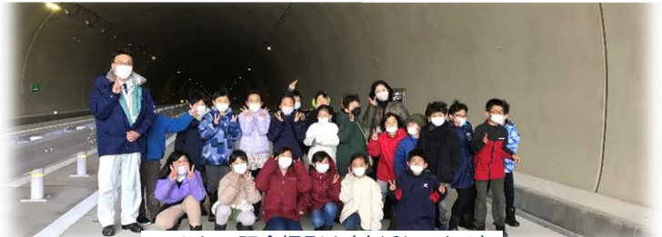
みんなで記念撮影！(東浜トンネル)